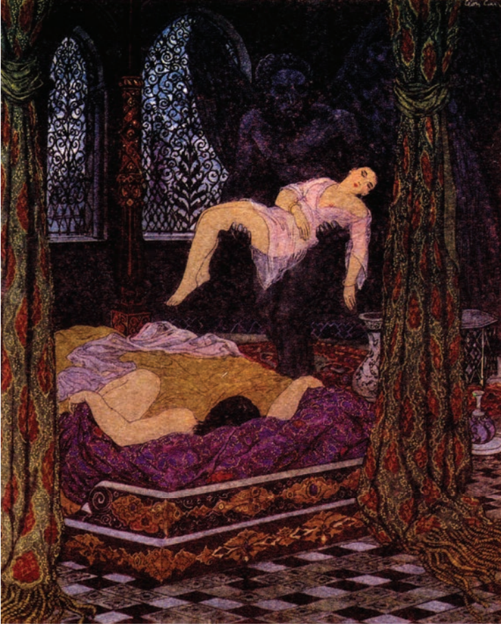
نزلا بتلك الصبية ومدداها بجانب الغلام، وكشفا عن وجهي الاثنين.

وَيَلَاهُ مِنْ قَمَرٍ بِكُلِّ مَلَاخَةٍ قَالَ الْعَوَازِلُ فِي الْهَوَى مَنْ ذَا الَّذِي يَا قَلْبَهُ الْقَاسِي تَعَلَّمَ عَطْفَةً لَكَ يَا أَمِيرِي فِي الْمَلَاخَةِ نَاطِرُ بَيْنَ الْأَنْثَامِ وَكُلُّ حُسْنٍ يُوصَفُ أَنْتَ الْكُتَيْبُ بِهِ فَقُلْتُ لَهُمْ صَفُوا مَنْ قَدَّهُ فَعَسَى يَرِقُّ وَيَعِطِفُ يَسْطُو عَلَيَّ وَحَاجِبٌ لَا يُنْصَفُ