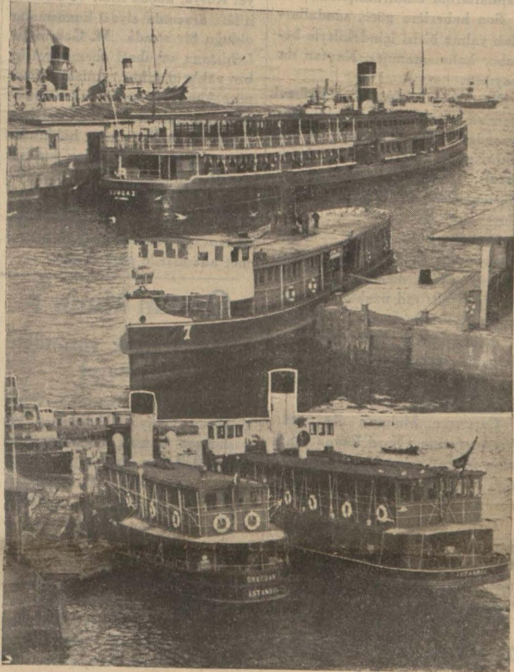
Akay, Halic ve Şirketihayriye vapurlarından birkaçı

«Üç idare birleşirse masraf azalacak, şehrin geliri artacak,, diyorlar