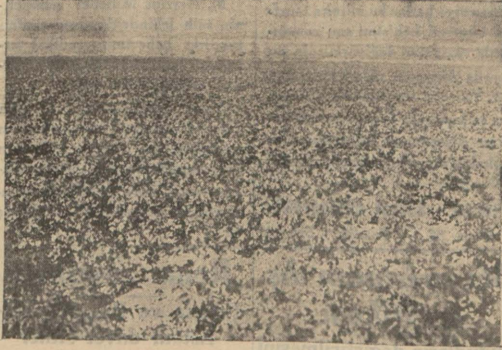
Zmir taraflarındaki pamuk tarlalarından biri

Yapılacak iş, Adana pamuk ziraatini, yalnız ihracat şartlarına uygun bir ziraat halinden çıkarıp,