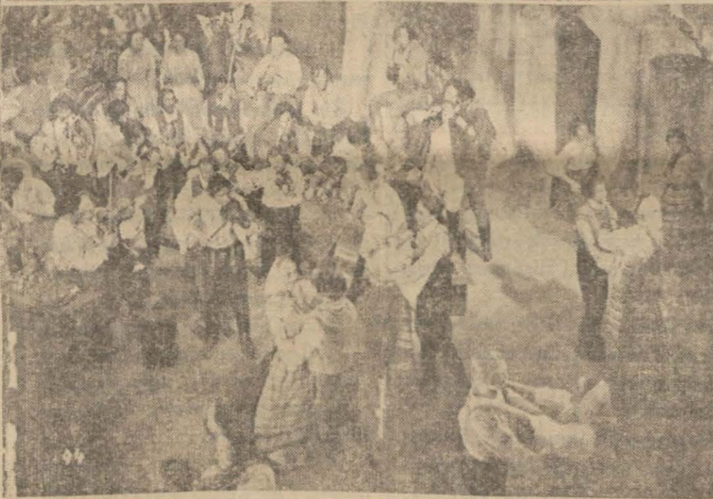
Çingene Baron filminden üç sahne: Yukarıda Çingene Baron ve zengin kız, çingene Baronun sevgilisi, aşağıda filminden macar danslarına aid bir sahne

çalıyor. Topraklarını geri alıyor. Fakir sevgilisi ile evleniyor.