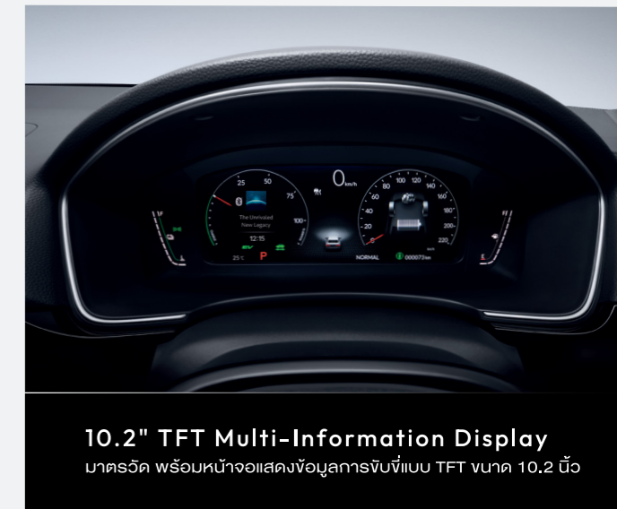
10.2" TFT Multi-Information Display มาตรวัด พร้อมหน้าจอแสดงข้อมูลการขับขี่แบบ TFT ขนาด 10.2 นิ้ว