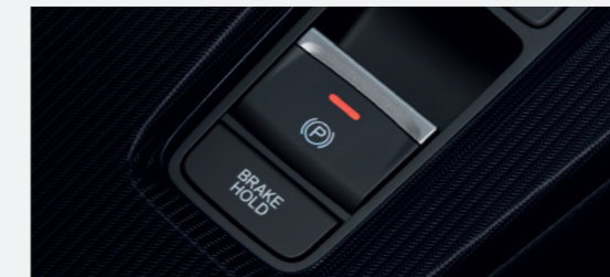
Electric Parking Brake & Auto Brake Hold ระบบเบรกมือไฟฟ้า และระบบ Auto Brake Hold