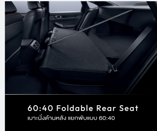
60:40 Foldable Rear Seat เบาะนั่งด้านหลัง แยกพับแบบ 60:40