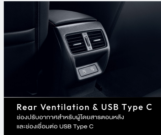
Rear Ventilation & USB Type C ช่องปรับอากาศสำหรับผู้โดยสารตอนหลัง และช่องเชื่อมต่อ USB Type C