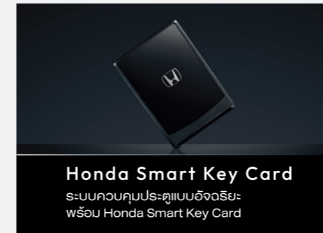
Honda Smart Key Card ระบบควบคุมประตูแบบอัจฉริยะ พร้อม Honda Smart Key Card