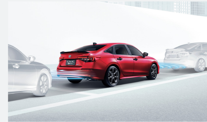
Parking Sensors เซนเซอร์ระยะหน้า 4 จุด และหลัง 4 จุด

เทคโนโลยีความปลอดภัยล้ำสมัย ให้คุณมั่นใจตลอดการเดินทาง