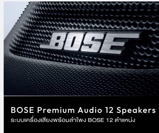
BOSE Premium Audio 12 Speakers ระบบเครื่องเสียงพร้อมลำโพง BOSE 12 ตำแหน่ง

ห้องโดยสารกว้างขวาง พร้อมอุปกรณ์อำนวยความสะดวก ที่จะทำให้การเดินทางของคุณสะดวกสบายยิ่งขึ้น