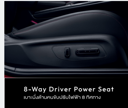
8-Way Driver Power Seat เบาะนั่งด้านคนขับปรับไฟฟ้า 8 ทิศทาง