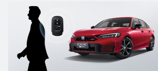
Walk Away Auto Lock ระบบล็อกรถอัตโนมัติเมื่อกุญแจรีโมทอยู่ห่างจากตัวรถ