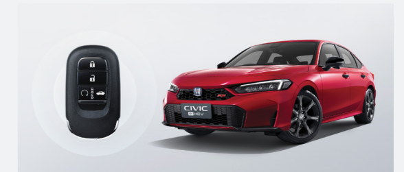
Remote Engine Start ระบบสตาร์ทเครื่องยนต์พร้อมเครื่องปรับอากาศด้วยกุญแจรีโมท

หมายเหตุ: ภาพข้างต้นเป็นเพียงภาพตัวอย่างเท่านั้น รายละเอียดหรืออุปกรณ์บางส่วนในภาพ อาจแตกต่างจากรถยนต์ที่จำหน่ายจริง