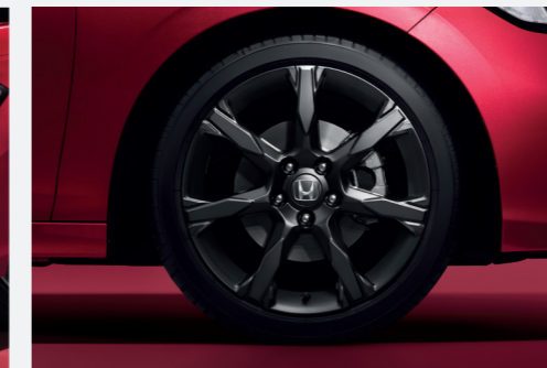
New 18" Matte Black Alloy Wheel ล้ออัลลอย ขนาด 18 นิ้ว Matte Black ดีไซน์สปอร์ต