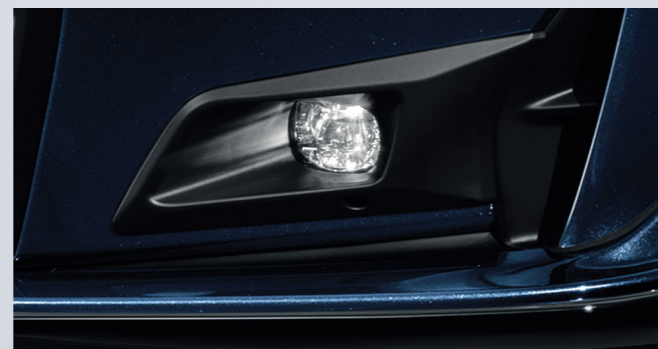
Fog Light: ชุดไฟตัดหมอก

หมายเหตุ: ภาพข้างต้นเป็นเพียงภาพตัวอย่างเท่านั้น รายละเอียดหรืออุปกรณ์บางส่วนในภาพ อาจแตกต่างจากรถยนต์ที่จำหน่ายจริง ทั้งนี้ บริษัทฯ ขอสงวนสิทธิ์ในการพิจารณาเปลี่ยนแปลงรายละเอียด หรืออุปกรณ์มาตรฐานตามที่เห็นสมควร