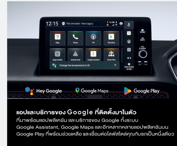
แอปและบริการของ Google ที่ติดตั้งมาในตัว ที่มาพร้อมแอปพลิเคชัน และบริการของ Google ทั้งระบบ Google Assistant, Google Maps และอีกหลากหลายแอปพลิเคชันบน Google Play ที่พร้อมช่วยเหลือ และเชื่อมต่อไลฟ์สไตล์คุณกับรถเป็นหนึ่งเดียว