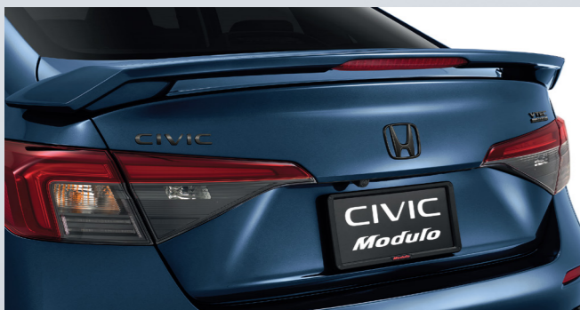
Black Emblem Set: ชุดโลโก้ สีดำ

รายละเอียดอุปกรณ์ตกแต่งเพิ่มเติมที่ www.hondaaccess.co.th/products/civic