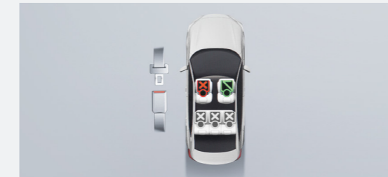
Front Passenger and Rear Seat Belt Reminder ระบบเตือนคาดเข็มขัดนิรภัยผู้โดยสารด้านหน้าพร้อมเตือนผู้โดยสารด้านหลัง