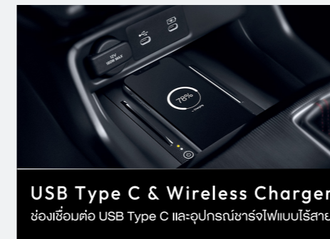
USB Type C & Wireless Charger ช่องเชื่อมต่อ USB Type C และอุปกรณ์ชาร์จไฟแบบไร้สาย