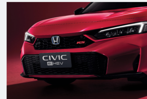
New Front Grille & Bumper กระจังหน้าและกันชนหน้าดีไซน์ใหม่

คือ ความเข้าใจที่โดดเด่นด้วยดีไซน์สปอร์ตใหม่ คือ พลังความแรงที่เกินกว่าใครจะต้านทาน คือ ความล้ำหน้าที่เต็มเต็มทุกไลฟ์สไตล์ คือ ความมั่นใจที่พร้อมในทุกการเดินทาง และนี่คือ ฮอนด้า ซีวิค ใหม่ ต้นแบบความสปอร์ตพรีเมียมของวันนี้