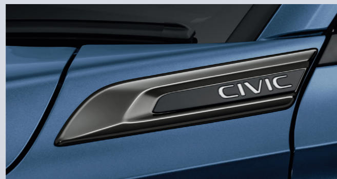
Fender Garnish: คิ้วตกแต่งซุ้มล้อด้านหน้า สีดำ