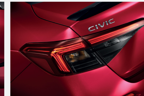
New LED Taillight with Black Lens ไฟท้ายแบบ LED สมดำ