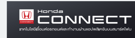
Honda CONNECT เทคโนโลยีเชื่อมต่อรถยนต์และทำงานผ่านแอปพลิเคชันบนสมาร์ตโฟน