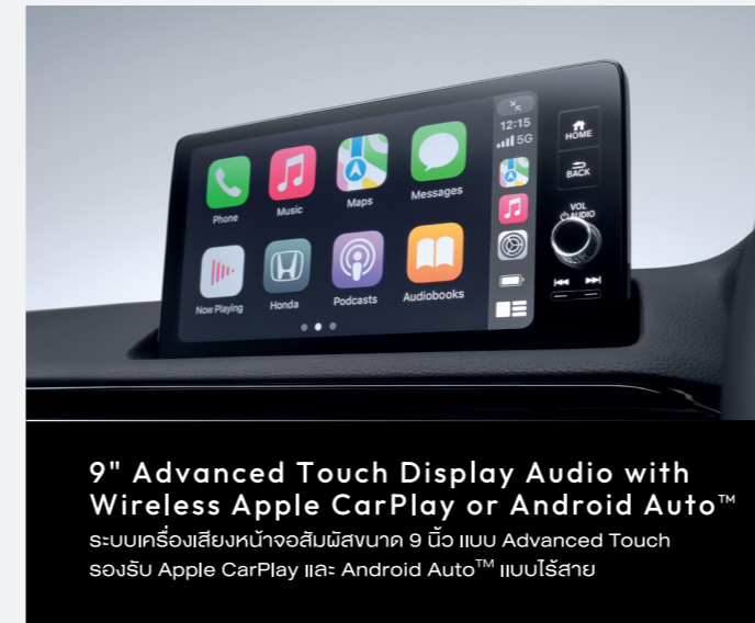
9" Advanced Touch Display Audio with Wireless Apple CarPlay or Android Auto™ ระบบเครื่องเสียงหน้าจอสัมผัสขนาด 9 นิ้ว แบบ Advanced Touch รองรับ Apple CarPlay และ Android Auto™ แบบไร้สาย