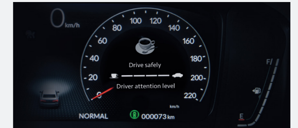
Driver Attention Monitor ระบบช่วยเตือนความเหนื่อยล้าขณะขับขี่