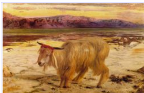
השעיר לעזאזל ששלח ביום הכיפורים, ציור מאת ויליאם הולמן האנט

עזים לחטאת ואיל אחד לעלה. ו והקריב אהרן את פר החטאת אשר לו, וכפר בעדו ובעד ביתו.