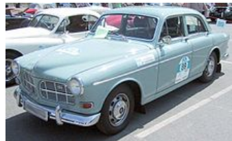
.Volvo 121 4 portes de 1965 au Rallye Historique de Kitzbühl