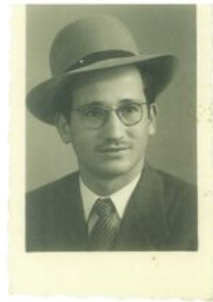
הוסיפו כיתוב כאן