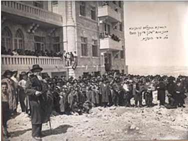
בית היתומים דיסקין 1927