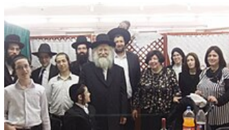
חלק מילדיו ונכדיו