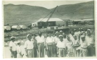
פעילי יד לאחים של הפעילים בפעילות נראה שם הרב שלמה שטנצל מראשי יד לאחים