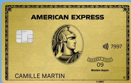
CARTE GOLD AMERICAN EXPRESS®