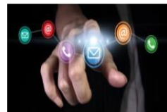
להגיש בקשה להטבה או מלגה