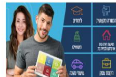
למשוך כספי פיקדון