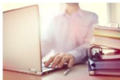
לעדכן פרטים אישיים