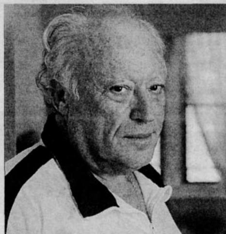
URIS respondía a las críticas con ironía. "Lo que pasa es que voy a las fiestas equivocadas", decía.

El escritor estadounidense León Uris, autor del best seller histórico Exodo, murió el sábado de causa natural a los 78 años en su casa de Shelter Island, Nueva York. Hijo de inmigrantes judíos provenientes de Europa del Este, Uris cobró notoriedad mundial cuando en 1958 publicó una ambiciosa novela que retrató la historia contemporánea de Israel. Tres años más tarde, el realizador Otto Preminger tradujo la obra literaria a una superproducción cinematográfica, consagrando definitivamente a un escritor que debió lidiar con la polémica: varias de sus obras fueron acusadas de falta de rigor histórico y sesgo racial en favor del pueblo judío.