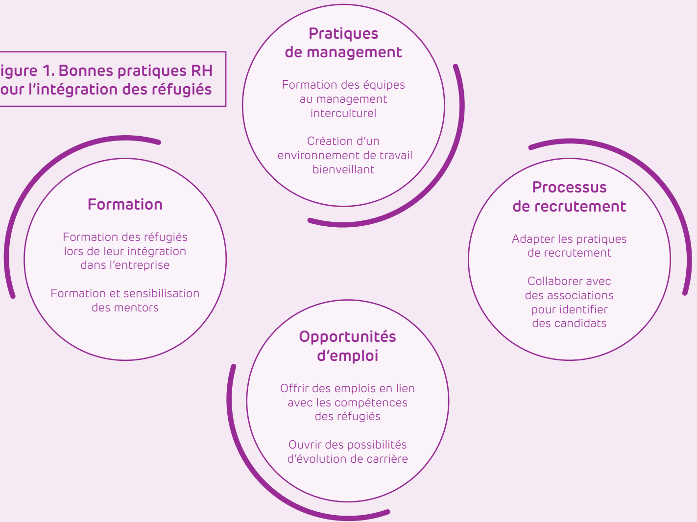
Figure 1. Bonnes pratiques RH pour l'intégration des réfugiés

implique de définir des objectifs clairs, de communiquer régulièrement sur le sujet et d'allouer les ressources nécessaires. Nous accompagnons les entreprises pour nourrir ce dialogue avec les ressources humaines et lever les éventuels obstacles à l'embauche de réfugiés. Le passage de relais à la direction RH est en effet un travail de conviction sur la durée et un investissement important de la part du top management. Sans cet engagement, les ressources humaines auront du mal à avancer et ne feront malheureusement pas toujours l'effort nécessaire pour adapter les processus de recrutement, accompagner l'entreprise dans le maintien de la personne réfugiée en poste ou mettre en place des actions de sensibilisation pour les équipes, etc. C'est dans ce contexte que nous sommes intervenus en décembre