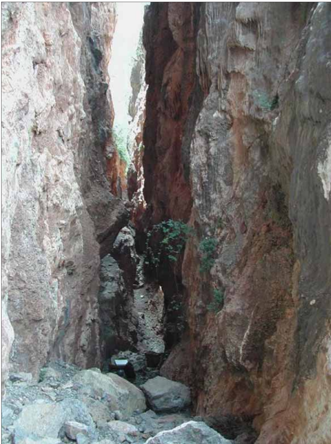
Figura 3: Falla en la que se encuentra la mina Cueva de la Guerra Antigua.

La mina “La Amorosa” se sitúa justo enfrente de la anterior (Fig. 4), desde donde son visibles sus trabajos, pero al lado este del Río del Carbón, junto a un puente de nueva construcción que cruza este río. El acceso a ella se realiza a través de una galería secundaria que se encuentra a media montaña. Las galerías tienen algo más de desarrollo que la anterior y presenta dos pequeñas cámaras (Fig. 5). Ambas explotaciones carecen de escombreras.