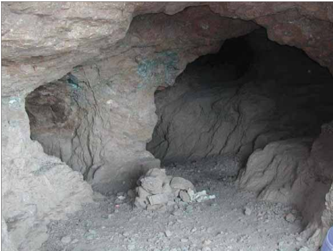
Figura 5: Interior de mina La Amorosa (Fot. R. Muñoz, 2003).

La oxidación de estos sulfuros y sulfoarseniuros, y la posterior lixiviación y depósito de sus elementos constituyentes, ha generado una amplia variedad de minerales secundarios. La Tabla 1 recoge un resumen de las especies minerales encontradas hasta el momento así como su distribución.