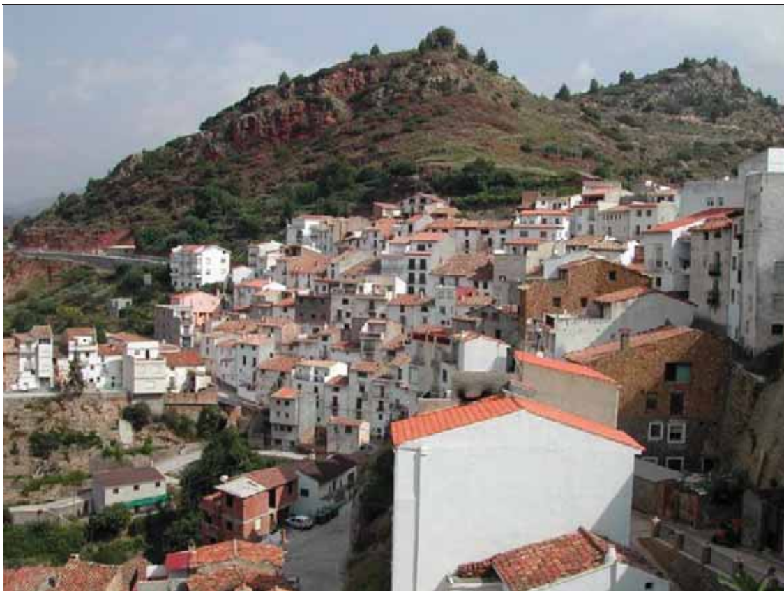
Figura 1: Villahermosa del Río, Castellón (Fot. R. Muñoz, 2003).