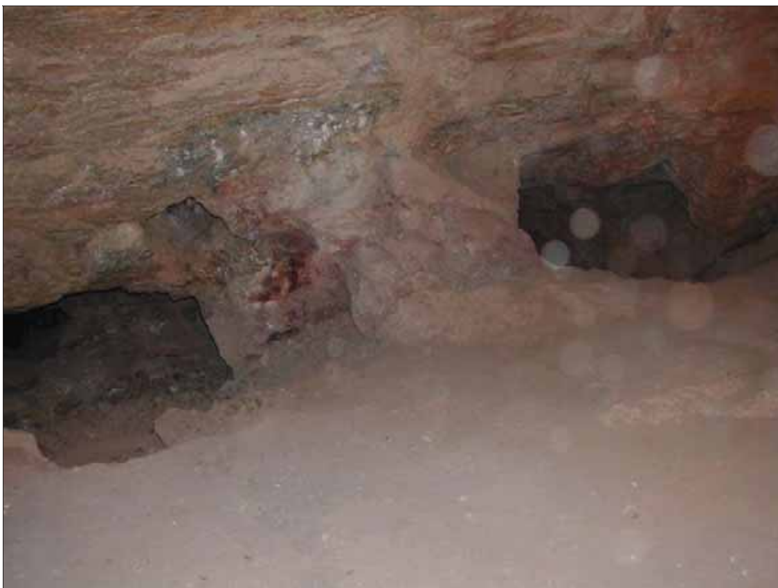
Figura 2: Interior en mina Cueva de la Guerra Antigua (Fot. R. Muñoz, 2003).