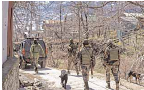
जम्मू कश्मीर में आतंकवादियों की तलाश में सुरक्षा बलों के जवान