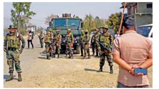
मणिपुर के सभी कुकी क्षेत्रों में कुकी जो काउंसिल द्वारा अनिश्चितकालीन बंद के दौरान तैनात सुरक्षाबलों की पीटीआई

रविवार को मणिपुर के कुकी-बहुल इलाकों में सामान्य जनजीवन प्रभावित रहा, क्योंकि आंदोलनकारियों ने 'सुरक्षा बलों की कार्रवाई' के खिलाफ कुकी-जो समूहों द्वारा बुलाए गए अनिश्चितकालीन बंद को लागू किया। कांगपोकपी जिले में स्थिति तनावपूर्ण लेकिन शांत रही, जहां पिछले दिन कुकी प्रदर्शनकारियों और सुरक्षा बलों के बीच झड़प में कम से कम एक व्यक्ति की मौत हो गई थी और 40 अन्य घायल हो गए थे। चुराचंदपुर और टेंगोपाल जिलों के अन्य कुकी-बहुल इलाकों में भी प्रदर्शनकारियों ने टायर जलाए और पत्थरों से सड़कें जाम कर दीं, जिन्हें सुरक्षा बलों ने हटाते हुए देखा। हालांकि, अभी तक किसी नई हिंसा की खबर नहीं आई है। राज्य में कुकी-बहुल इलाकों में व्यापारिक प्रतिष्ठान बंद रहे और सड़कों पर बहुत कम वाहन चलते देखे गए। आंदोलनकारी लोगों से घरों के अंदर रहने के लिए कहते देखे गए। जिले के एक अधिकारी ने बताया कि एनएच-2 (इंपाल-दीमापुर रोड) पर गमघोर्फई और जिले के अन्य हिस्सों में अतिरिक्त सुरक्षा बलों को तैनात किया गया है