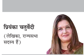
प्रियंका चतुर्वेदी (लेखिका, रायस्वभा सदस्य हैं)

महिला मुद्दों को हाशिए पर धकेलने के बजाय उनको नीति-निर्माण तथा प्रशासन का अभिन्न अंग बनाना चाहिए। इस अंतरराष्ट्रीय महिला दिवस पर हमें प्रतीकात्मक संकेतों तथा लफ्फजी से आगे बढ़ना चाहिए।