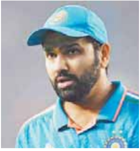
ऑफ द मैच रहे रोहित

भारतीय कप्तान रोहित शर्मा ने रविवार को यहां न्यूजीलैंड को चार विकेट से हराकर तीसरी दफा आईसीसी चैंपियन्स ट्रॉफी अपने नाम करने के बाद कहा कि मुकाबले में नतीजा अपने हक में होना शानदार अहसास है। फाइनल में 76 रन की अर्धशतकीय पारी खेलकर प्लेयर ऑफ द मैच रहे रोहित ने मैच के बाद कहा, हमने पूरे टूर्नामेंट में अच्छा क्रिकेट खेला। अपने मनमुताबिक परिणाम प्राप्त करना एक शानदार अहसास है। आक्रामक शैली से खेलना मेरे लिए यह स्वाभाविक नहीं है लेकिन मैं सही में ऐसा करना चाहता था। उन्होंने कहा, जब आप कुछ असंग कर रहे होते हैं तो आपको टीम और प्रबंधन का समर्थन प्राप्त होना चाहिए। मैंने पहले गहलु ( गहलु द्रविड) भाई से बात की और अब गौटी ( गौतम गंभीर) भाई से भी। मैं वास्तव में ऐसा करना चाहता था। मैं इन वर्षों में एक अलग शैली में खेला और अब हम इस शैली के साथ परिणाम हासिल कर रहे हैं। विराट कोहली हालांकि बड़ी पारी नहीं खेल पाए। उन्होंने कहा, यह अद्भुत रहा है,