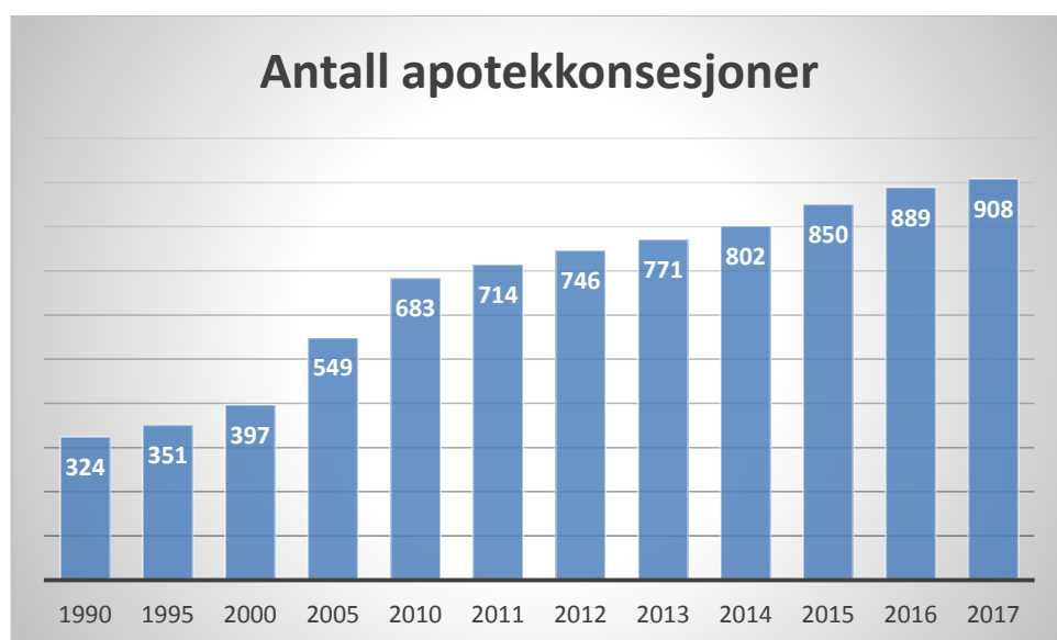
Diagram nr. 1

Legemiddelverket har laget en oversikt over utvikling i apotekdekningen i et eget notat 2 . Følgende figur viser apotekdekning etter kommuners sentralitet i perioden 1998-2017. Se notatet på www.legemiddelverket.no for nærmere informasjon.