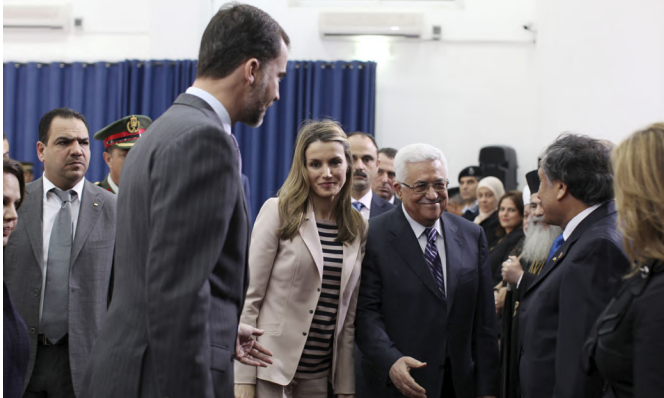
SS.AA.RR. los Príncipes de Asturias, junto al presidente de la Autoridad Nacional Palestina, Mahmoud Abbas, durante su visita a Ramala en abril de 2011.

presidente, cargo que sigue ocupando en la actualidad. Siguen pendiente de celebrarse desde 2009 las elecciones presidenciales.