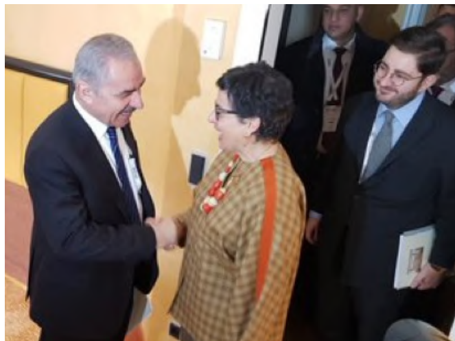
Encuentro entre la ministra Unión Europea y Cooperación, Dª Arantxa González Laya y el primer ministro palestino Mohammed Shtayyeh, durante la reunión de la Conferencia de Seguridad celebrada en Munich (Alemania)- Febrero 2020.

La inversión extranjera es muy reducida. El país con mayor inversión, tanto en IED como en IEC, es Jordania , con 1.610 millones de USD y 394 millones de USD respectivamente. La mayoría de los inversores en los Territorios Ocupados Palestinos son países árabes .