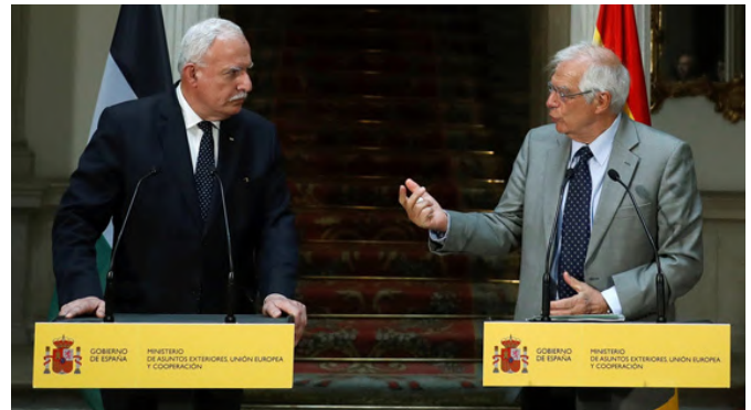
El entonces ministro de Asuntos Exteriores, Unión Europea y Cooperación Sr Borrell junto a su homólogo de Palestina, Sr Riad Malki. Madrid (Palacio de Viana), 04/09/2018

La guerra en Gaza ha revitalizado la solución de los dos Estados como única forma posible de acabar con el conflicto y lograr la paz. La Unión Europea asumió la propuesta española de convocar una Conferencia Internacional de Paz y la cuestión del reconocimiento también ha cobrado relevancia. Actualmente [12 de noviembre de 2024] 146 países reconocen a Palestina como Estado. España, Noruega e Irlanda hicieron efectivo su reconocimiento el 28 de mayo de 2024. El 10 de mayo de 2024, la AGNU votó por mayoría abrumadora (143 votos a favor) la concesión a Palestina de más derechos propios de Estado miembro, y el 18 de septiembre la AGNU votó por mayoría de 124 votos a favor una resolución sobre la implementación del dictamen del Tribunal Internacional de Justicia de 19 de julio de 2024, sobre la ilegalidad de la ocupación israelí de los territorios palestinos. Con impulso del ARVP Borrell y del Grupo de Contacto de la Liga Árabe y la Organización de Cooperación Islámica se creó el pasado 26 de septiembre la Alianza Global para la Aplicación de la Solución de los dos Estados, en la que participan más de 90 países y que celebró su primera reunión en Riad el pasado 30 de octubre de 2024.