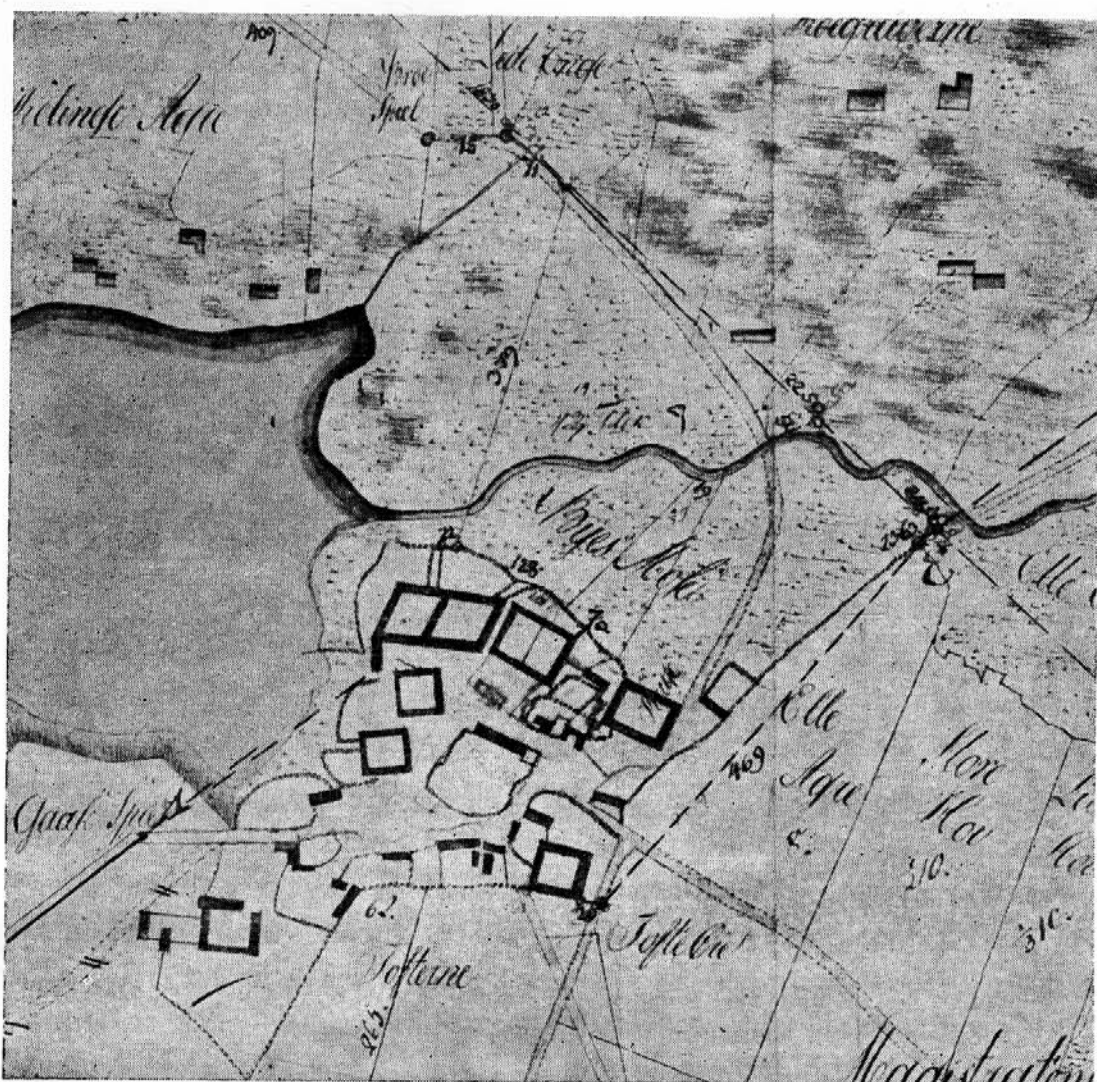
Tanbergs 1789-kort over Østrup by. Gårdene markeret med firkanter. Nordligst i byen ses 4 gårde, deraf længst mod vest de sammenbyggede matr. nr. 3 og 4. I indelukket ligger to gårde og sydvestligst på kortet Østrupgaard. Endelig sydøstligst i byen — d.v.s. tilhøjre på kortet — matr. nr. 6, „Magistratsgaarden“. Kortet placeret nogenlunde nord-syd.

lem Herringløse- og Gunsøllivejene, men fæstemålene er hævet, således at jorderne kunne lægges ind under Østrupgaard. Det drejede sig — tre stadig bortfæstede parceller østligst i marken inclusive — om godt 120 tdr. land, hvad der lige svarer til to fæstegårde. Den ene gårds stuehus lå iøvrigt nede i indelukket lige til midt i forrige århundrede, da dette og resterne af matr. nr. 5 brændte. Ved samme lejlighed skal den gamle smedie også være gået op i luer.