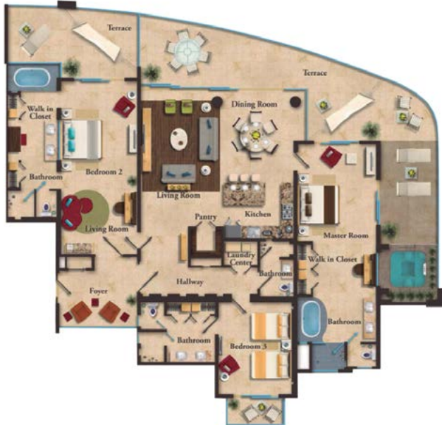
BEACH FRONT RESIDENCE RESIDENCIA FRENTE AL MAR