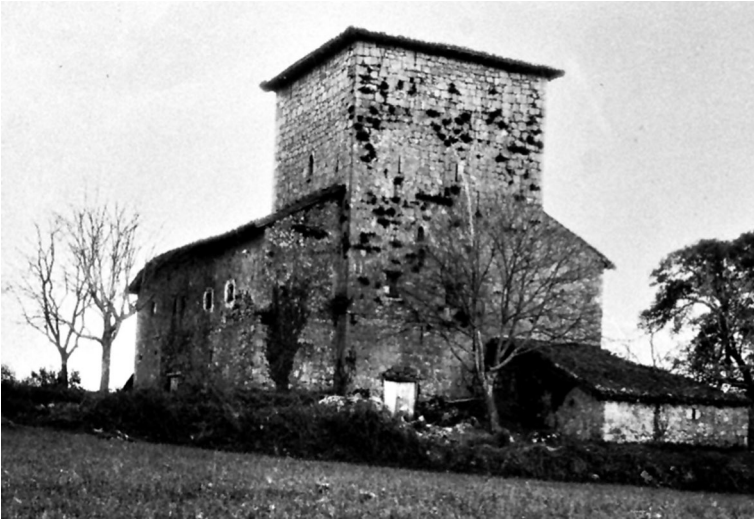
Casa torre de Urdaibai (Forua) antes de su incendio en 1929.

Gaztelugatxe, humanizado por un istmo de arcos, 241 escalones y la ermita de San Juan protectora de arrantzales.