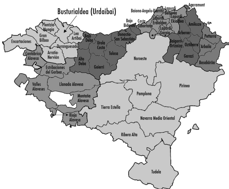
MAPA 4. COMARCAS DE EUSKAL HERRIA