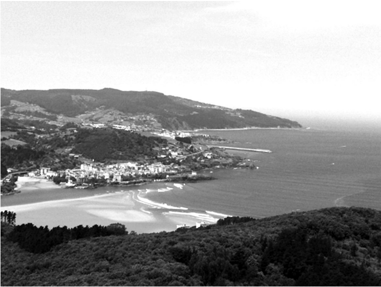
Omega: desembocadura de la ría de Mundaka, fin de Urdaibai. RAMÓN ZALLO