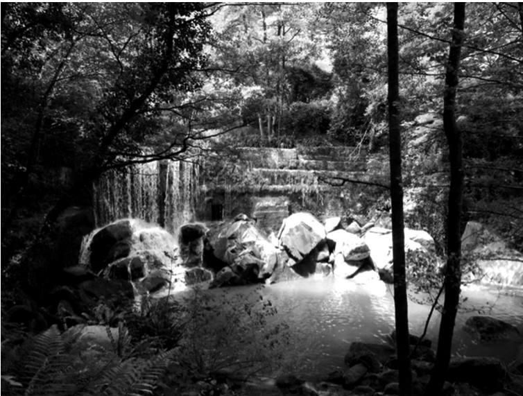
Alfa: nacedero del río Oka, origen de Urdaibai. RAMÓN ZALLO