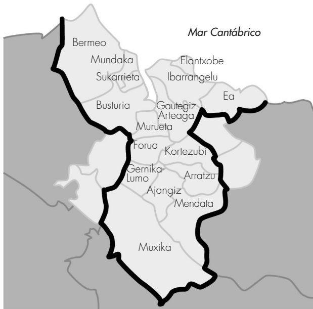
MAPA 1. URDAIBAI