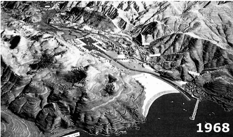
Imagen del retirado y ecológico Plan Especial de Aprovechamiento de la Ría de Mundaka de los años sesenta.

CÁMARA DE COMERCIO, INDUSTRIA Y NAVEGACIÓN DE BILBAO (1972)