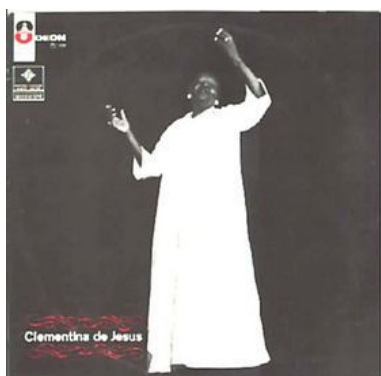
Capa do LP Clementina de Jesus (Odeon- 1966)