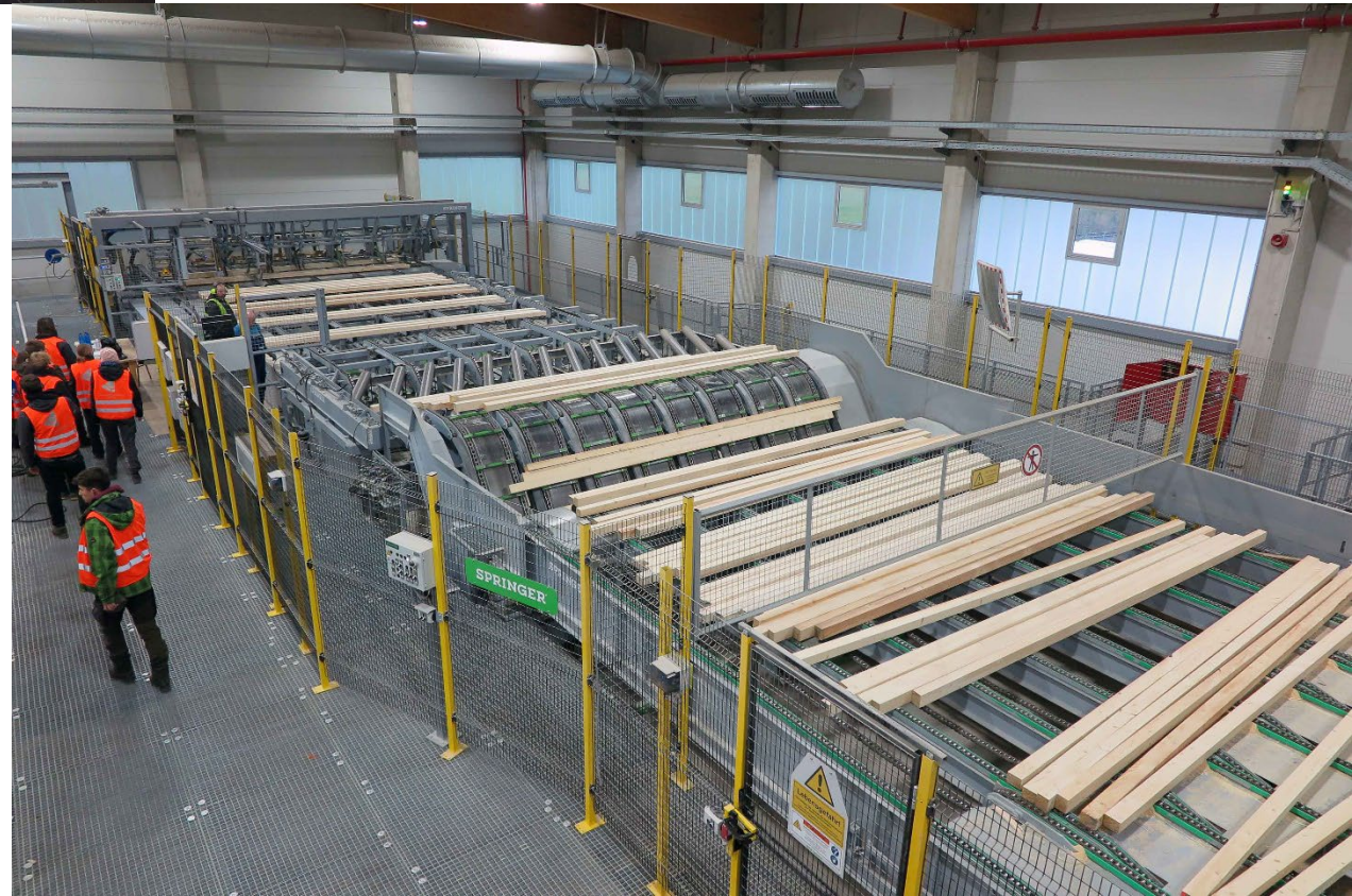
Holzabsatz und Kundenorientierung: Lehrfahrt zum modernsten Großsägewerk Mitteleuropas. Nach der Besichtigung des Werks konnten die Studierenden noch mit dem CEO des Unternehmens sprechen.