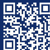
Проект Data Culture

аудитория онлайн-курсов университета на Национальной платформе открытого образования