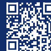
Международный бакалавриат по бизнесу и экономике