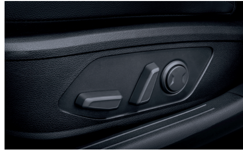
운전석 전동시트(8way, 럼버서포트)