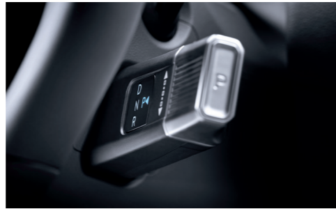
전자식 변속 칼럼