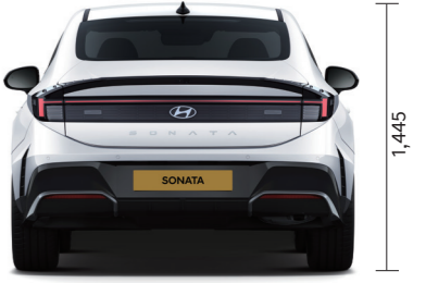
윤거후 1,630 단위: mm