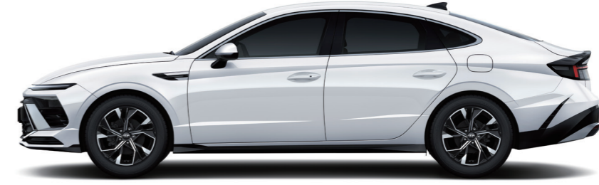
축간거리 2,875 전장 4,945