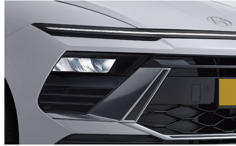
심리스 호라이즌 램프(수평형 LED 램프-주간주행등, 방향지시등(앞), 포지셔닝 램프)