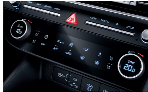
듀얼 풀오트 에어컨(미세먼지센서/공기청정모드/에프터 블로우 포함)