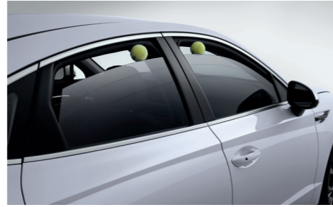
세이프티 파워 윈도우(전좌석)