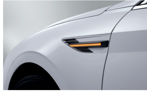
펜더 LED 방향지시등