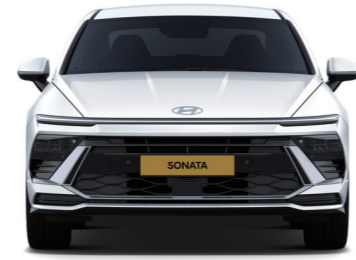
윤거전 1,623 전폭 1,860