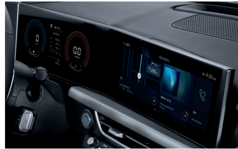
클러스터(4.2인치 컬러 LCD)/12.3인치 디스플레이