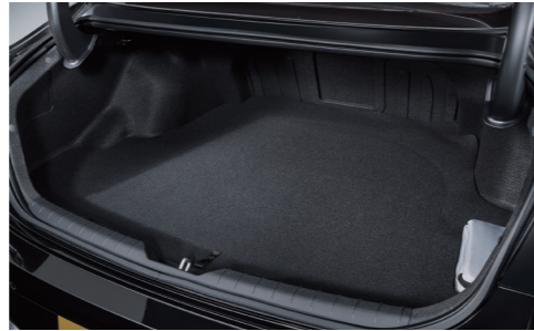
트렁크 용량 증대(구형 소나타 택시 모델 대비 +60ℓ)