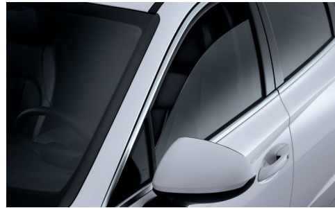
이중접합 차음유리(윈드실드, 1열도어)