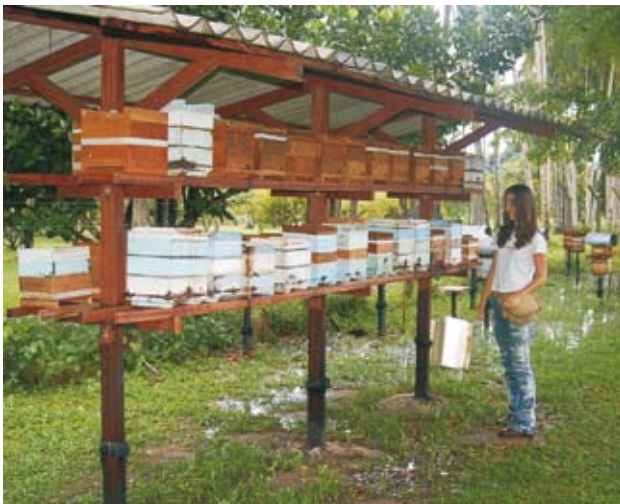
Fig. 2. Abrigo comunitário para colméias de abelhas indígenas sem ferrão utilizado na Embrapa Amazônia Oriental e coberto com telhas de fibrocimento.