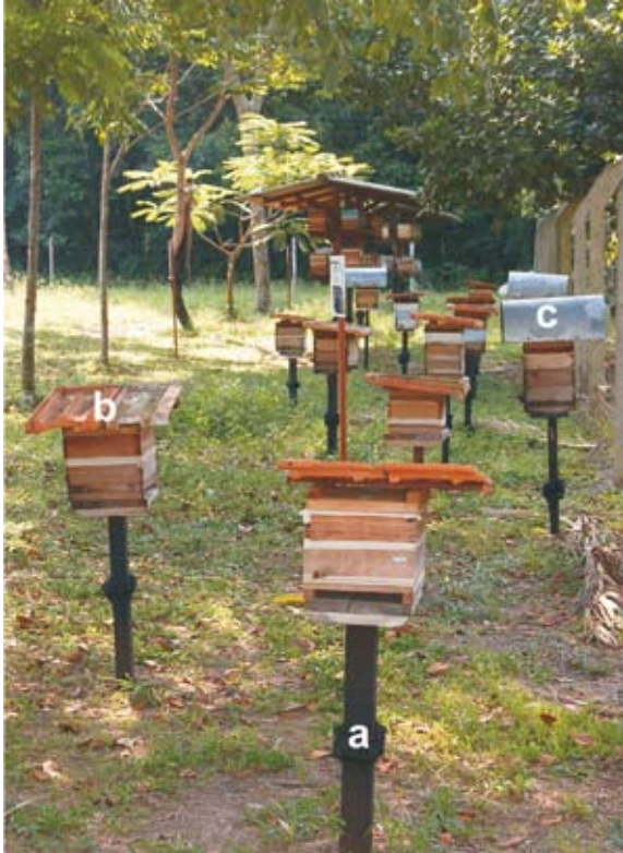
Fig. 1. Abrigos individuais para colônias de abelhas indígenas sem ferrão utilizados na Embrapa Amazônia Oriental. Note a estopa com óleo queimado na base dos abrigos (a) e as telhas de barro (b) e metal (c) cobrindo as colméias.