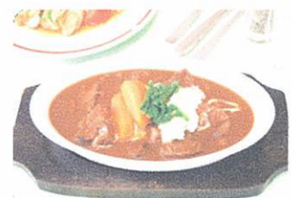
お肉たっぷりのビーフシチュー