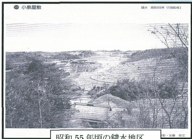
昭和55年頃の鎌水地区