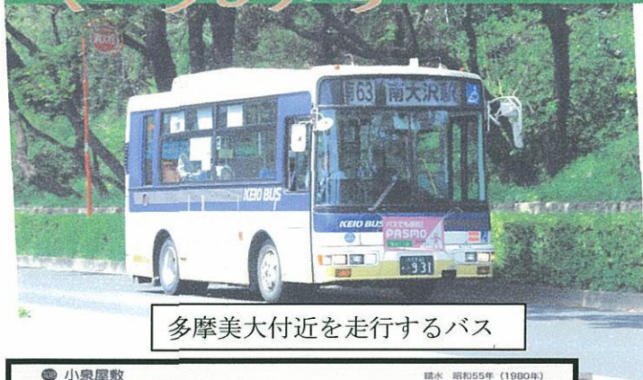
多摩美大付近を走行するバス