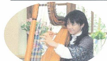
取材当日は心の和むハープの生演奏でした