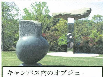
キャンパス内のオブジェ

日曜日以外は一般公開されているのがうれしい。毎年 11 月には文化祭も行われています。