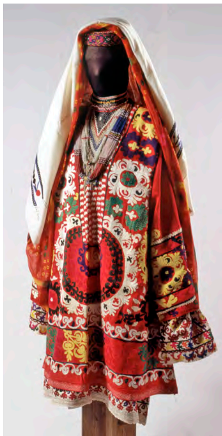
Илл. 3. Костюм горной таджички. 1960—1970-е годы. РЭМ, слайдотека № 1267

вое колористическое решение фона и его соотношение с цветовой гаммой узора, ставшие основными в последующие десятилетия. В 1920—1930-х годах фабричные ткани распространились и в горных районах, в моду вошли платья из красного и желтого штапеля, сатина и шелкового атласа, которые расширялись многоцветными вышитыми узорами (илл. 3).