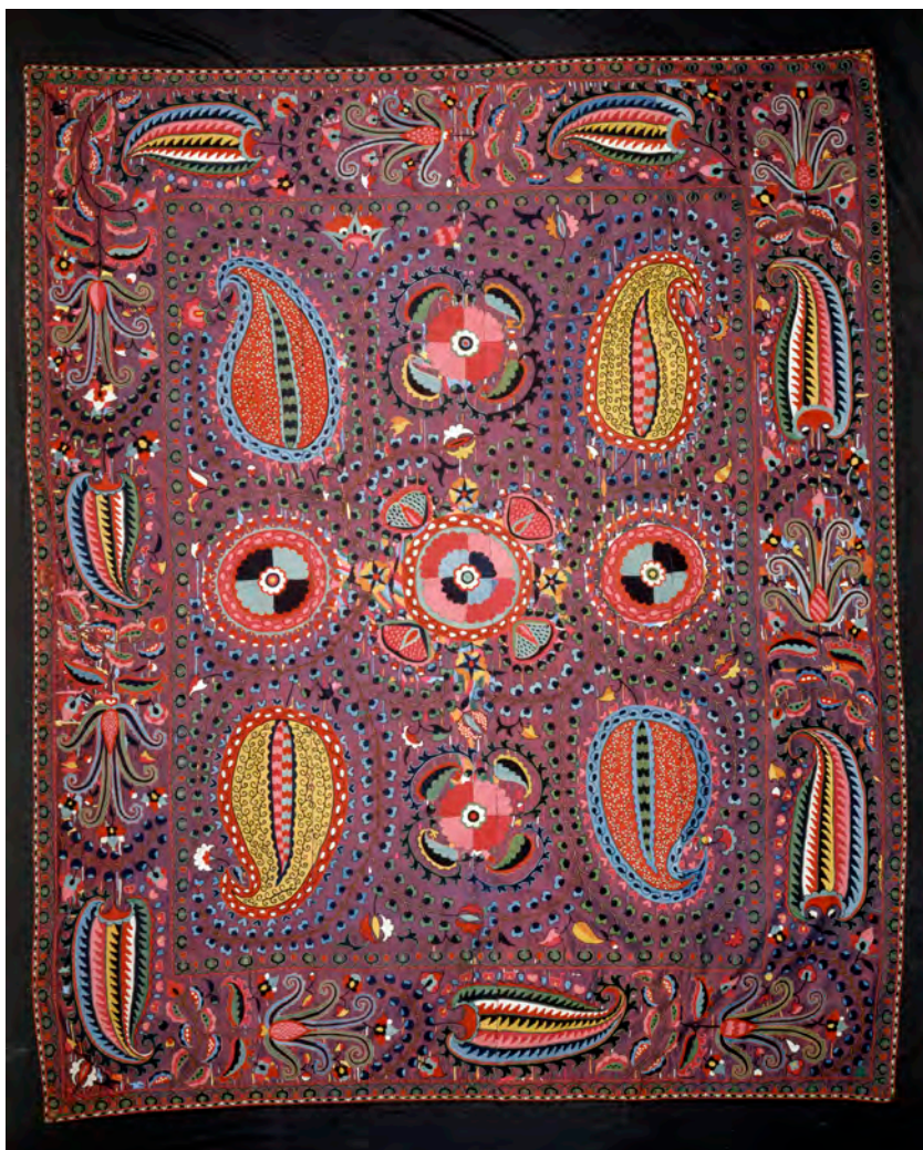
Илл. 4. Сузани . Шахриябз. Вторая половина XIX в. РЭМ, колл. № 8762-21847