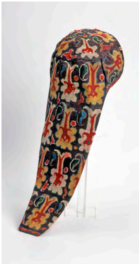
Илл. 5. Култаушак — женская шапочка с наосником. Шахриябз. Конец XIX в. РЭМ, колл. № 58-286

покрывала не развешивались по стенам, как это было принято в других местах, а стелились на постели одна на другую таким образом, чтобы была видна кайма каждой из них.