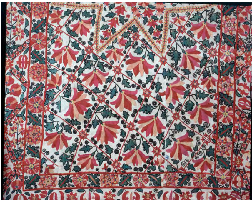
Илл. 6. Сузани . Бухара. Середина XIX в. РЭМ, колл. № 8762-21829

ные, переданные в растительных формах образы животных, бытовых предметов, явлений природы, космогонические знаки. Одним из наиболее излюбленных орнаментальных мотивов вышивок стали круглые розетки, окруженные цветочно-лиственным орнаментом, монохромные либо заполненные внутри разнообразными по форме и различными по цвету фигурами. В зависимости от внутреннего и внешнего оформления и в соответствии с теми представлениями, которые традиционно вкладывали жители той или иной местности в данный узор, он получал различные названия. В одних районах он ассоциировался с луной мах (Нурата), в других — с тюльпаном лола (Самарканд, районы р. Зеравшан), в Бухаре имел название офтоб — «солнце» 21 .