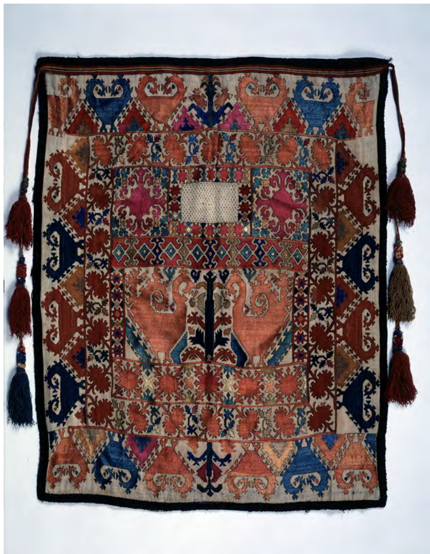
Илл. 2. Рубанд — лицевая занавеска. Горные таджики. Вторая половина XIX в. РЭМ, колл. № 8762-22298