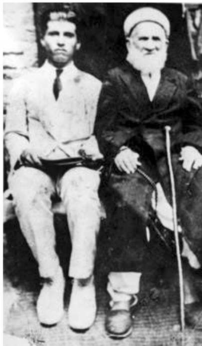
Рис. 1. Ингуши в Турции

вечность половину эмигрантов» [Альтемиров 1919: 23]. Обманутые в своих надеждах и разочарованные переселенцы искали возможность вернуться на родину. Зная о бедственном положении соотечественников, почетные представители 15 аулов Назрановского общества в 1869 г. подали прошение с просьбой вернуть из Турции 76 дворов их родственников, причем в документе отмечено, что они обязуются принять на себя все издержки по возвращению, отвечать за их поведение и поместить на отведенной им земле, а для разыскания места жительства просят отправить на свой счет в Турцию «доверенных лиц» [Дзагуров 1925: 163]. Просьба переселенцев не была удо-