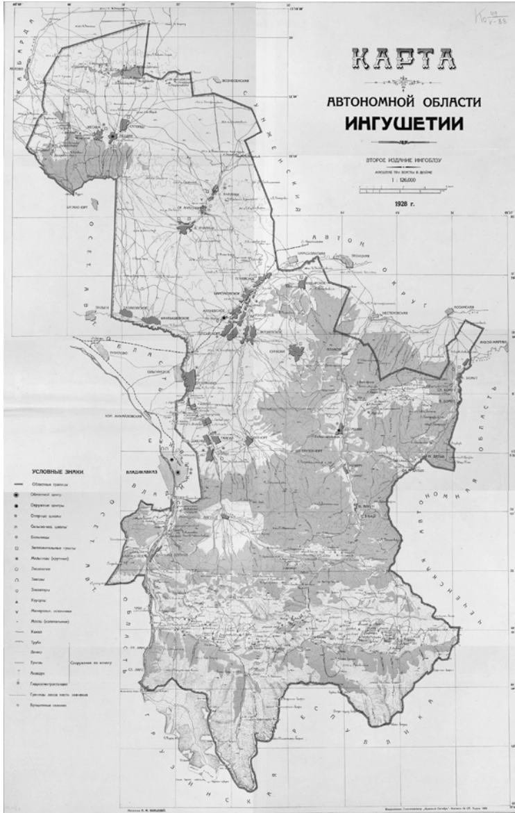
Рис. 3. Карта Ингушской автономной области