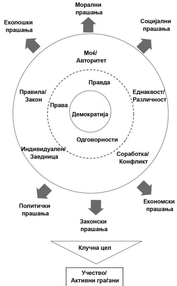
Шема на клучните концепти за ОДГ/ОЧП

Стрелките кои се насочени кон надвор укажуваат дека сите овие концепти можат да бидат користени во справување со прашања од најразлични видови – морални, социјални, економски, законски, политички или еколошки.