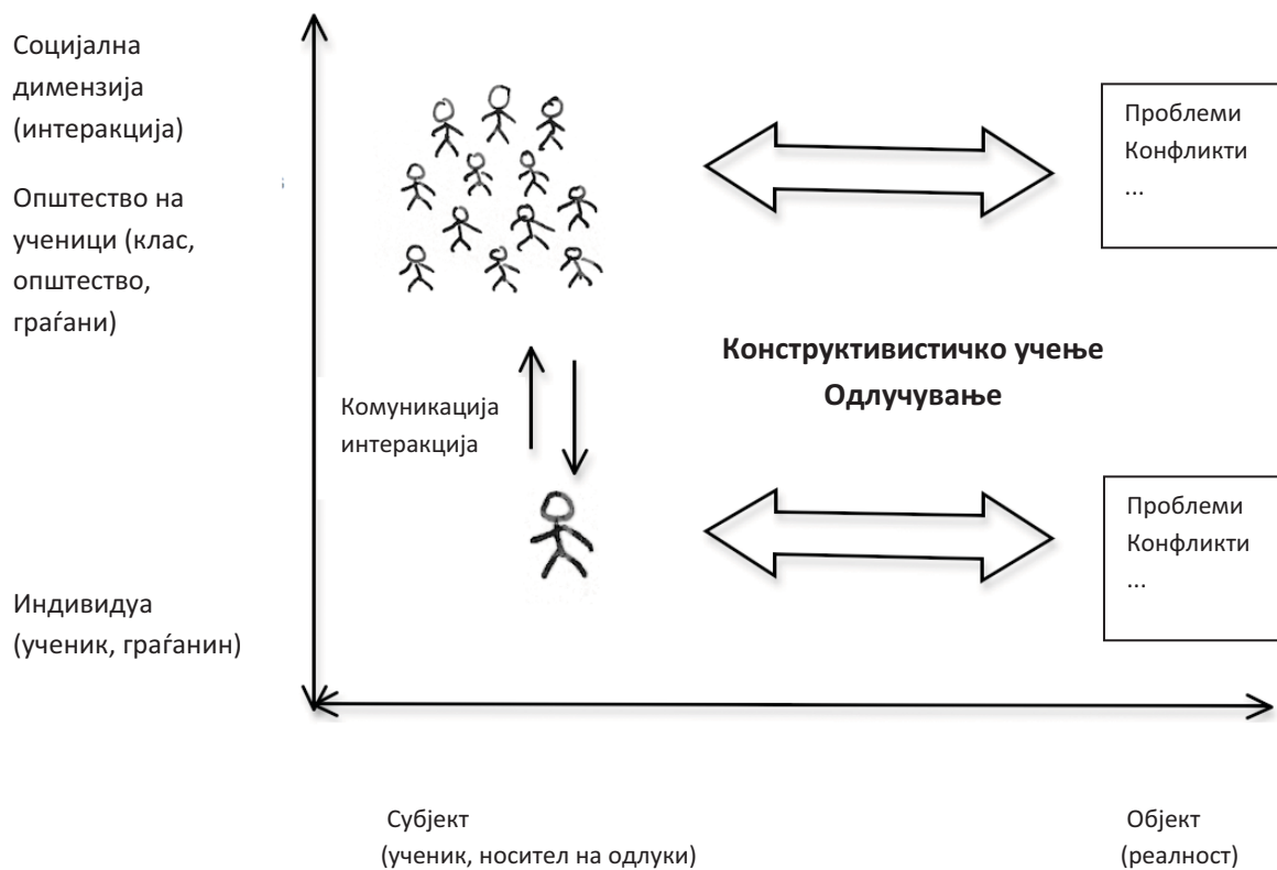
Димензии на учење и одлучување

Учениците во класот и граѓаните во демократските општества дејствуваат како заедници на ученици. Веќе го споменавме Џон Дјуи, кој го смета училиштето за „мала заедница, ембрионско општество“ 7 . Затоа интеракцијата која учениците ја доживуваат во училиштето, со соучениците и наставниците, е дел од вистинскиот живот а не вештачка средина која би ги подготвила за вистинскиот живот подоцна.