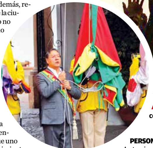
ACTOS. El presidente Luis Arce participa en la ceremonia de apertura del año del Bicentenario.

Uno de los aspectos menos conocidos de la independencia boliviana es que el levantamiento en Chuquisaca fue uno de los primeros movimientos independentistas en América del Sur. Aunque muchas personas asocian la independencia con figuras como Simón Bolívar, es importante destacar que las primeras semillas de resistencia se plantaron en esta región. Además, el proceso no fue lineal, ya que estuvo marcado por una serie de conflictos internos y alianzas temporales que complicaron la lucha por la autonomía.