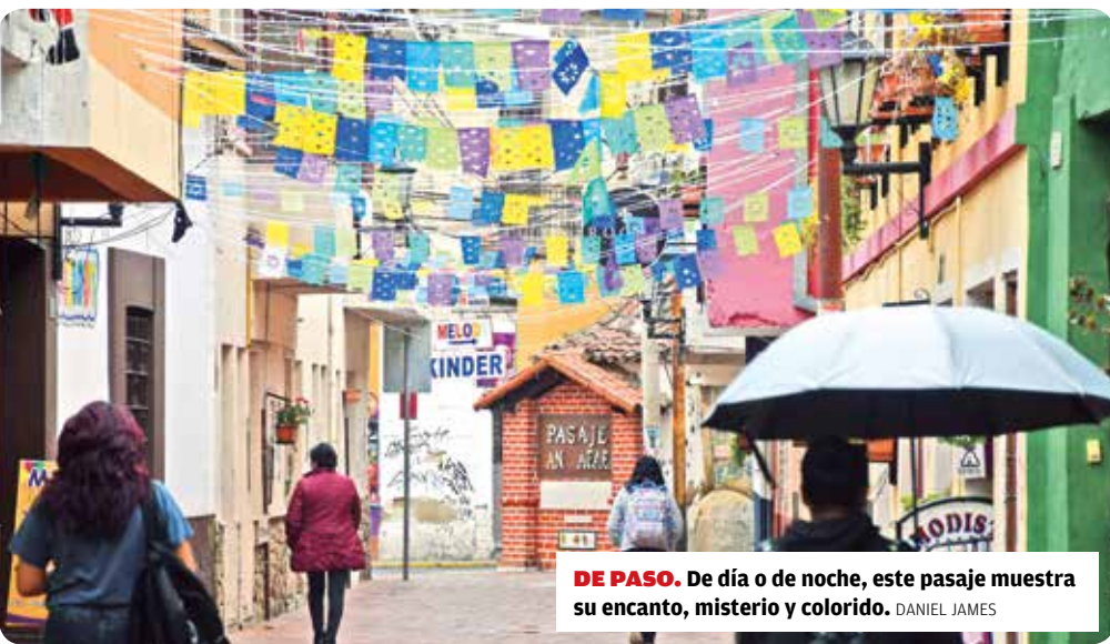
DE PASO. De día o de noche, este pasaje muestra su encanto, misterio y colorido. DANIEL JAMES