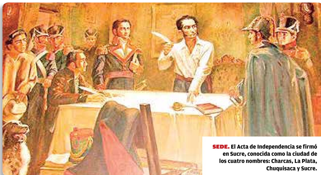
SEDE. El Acta de Independencia se firmó en Sucre, conocida como la ciudad de los cuatro nombres: Charcas, La Plata, Chuquisaca y Sucre.

Revilla señala que la sociedad colonial estuvo fuertemente estratificada y discriminó a la población según su origen. “Aunque no podemos generalizar, no cabe duda de que la mayor parte de quienes tenían ascendencia indígena y afrodescendiente participaron