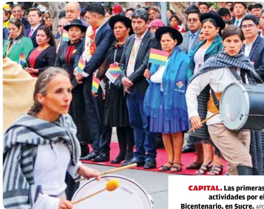
CAPITAL. Las primeras actividades por el Bicentenario, en Sucre.