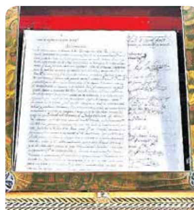
DOCUMENTO. Aunque fue redactada hace casi 200 años, el Acta de Independencia sigue siendo un símbolo de la lucha por la libertad y la soberanía en Bolivia.

Desde una perspectiva histórica, varios hitos deberían ser destacados durante las celebraciones del Bicentenario. Entre ellos se encuentran las Juntas de Gobierno que marcaron el inicio del proceso independentista, las batallas decisivas lideradas por Sucre y Bo-