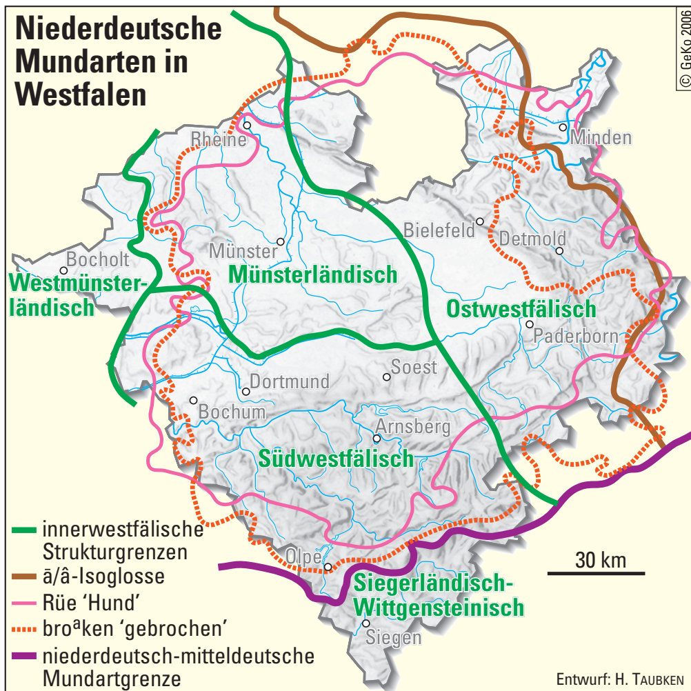
Abb. 3: Niederdeutsche Mundarten in Westfalen (Entwurf: H. TAUBKEN, verändert aus: Geographisch-landeskundlicher Atlas von Westfalen und E. NÖRRENBURG, Die Grenzen der westfälischen Mundart)

zum Ersten Weltkrieg dieser Wandel weitgehend abgeschlossen, auf dem Lande dauerte er etwa eine Generation länger.