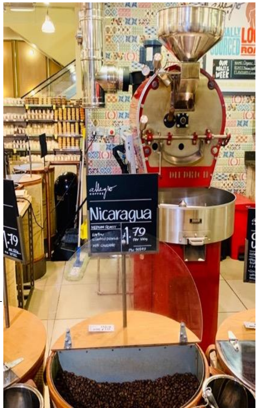
CAFÉ NICA EN CADENA WHOLEFOODS DE AMAZON.