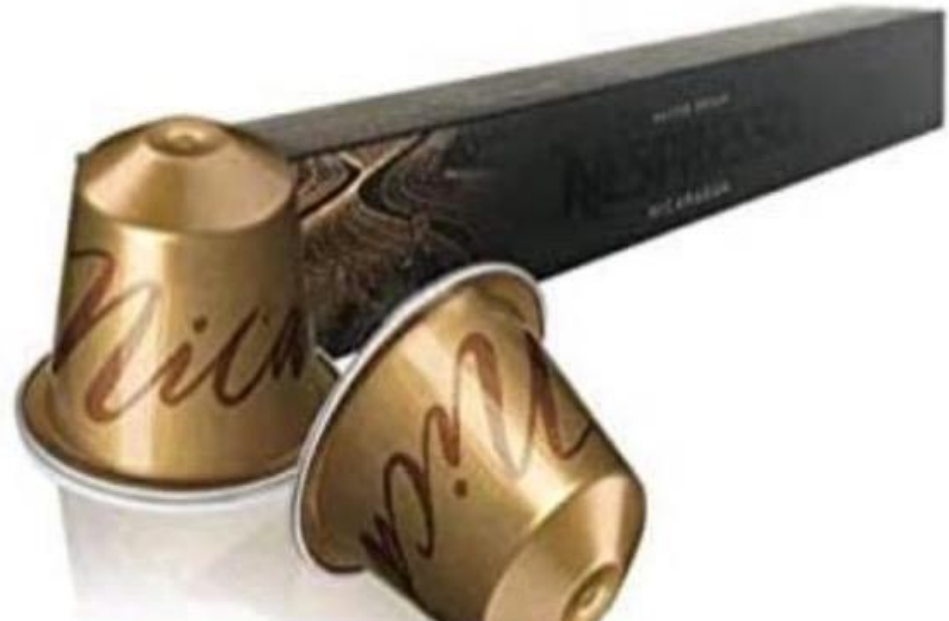
Cápsulas Nicaragua de Nespresso.