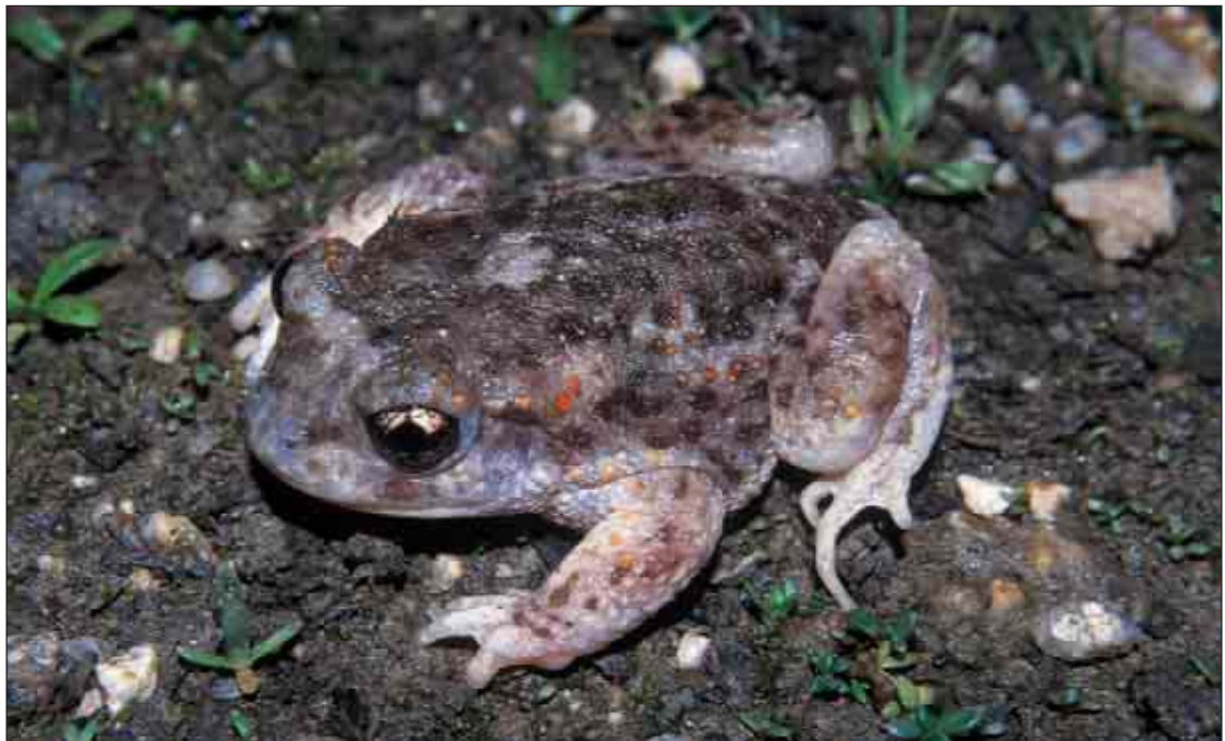
Ejemplar de Valdemanco, Madrid