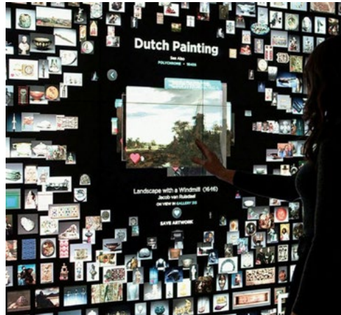
מידע והפעלה חדשניים