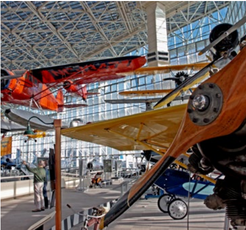
תצוגות כלי טיס ופריטים