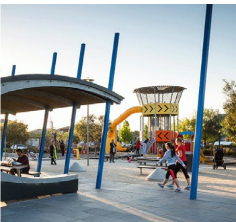
תצוגות ופעילות חוץ