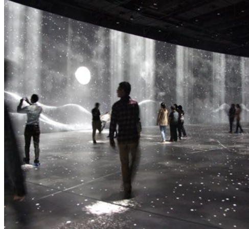
חוויות רב חושיות