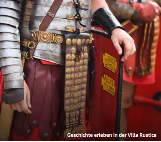
Geschichte erleben in der Villa Rustica