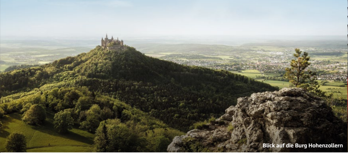
Blick auf die Burg Hohenzollern