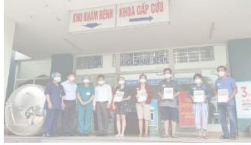
Thêm 5 bệnh nhân COVID-19 ở Đà Nẵng đã khỏi bệnh, xuất viện