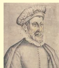
JUAN DE MAL LARA (1524-1571)