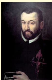
BENITO ARIAS MONTANO (1527-1598)