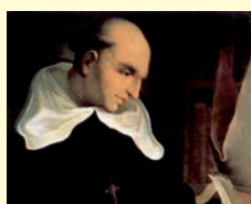
BARTOLOMÉ DE LAS CASAS (1474 o 1484-1566)