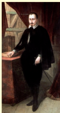
JERÓNIMO ZURITA (1512-1580)