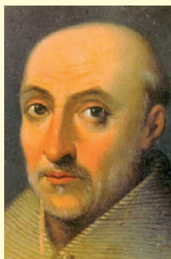
JERÓNIMO GRACIÁN (1545-1614)