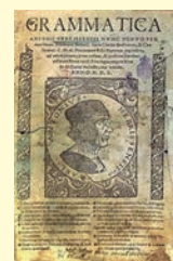
ELIO ANTONIO DE NEBRIJA (1441-1522)