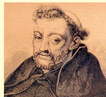
FRAY LUIS DE LEÓN (1527/1528-1591)