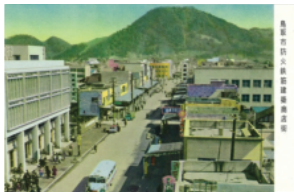
鳥取市防火鉄筋建築商店街（昭和30年代の絵葉書）