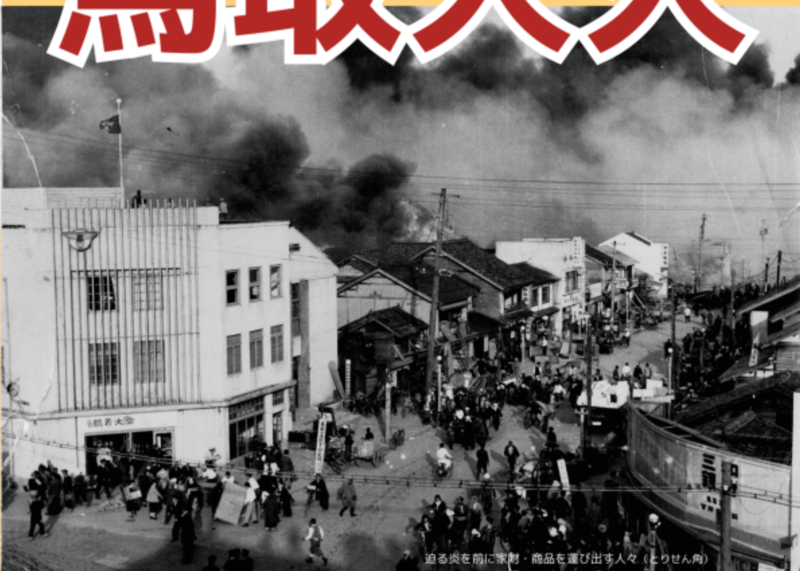
迫る炎を前に家財・商品運び出す人々（とりせん角）