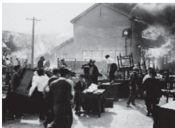
家財道具を運ぶ人々（場所不明）

人々は、家財道具を運び出すことが精一杯で、火の入った家屋を気にかける様子はない。