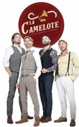
« C'EST PAS DE VINTAGE... C'EST DU VINTAGE ! »