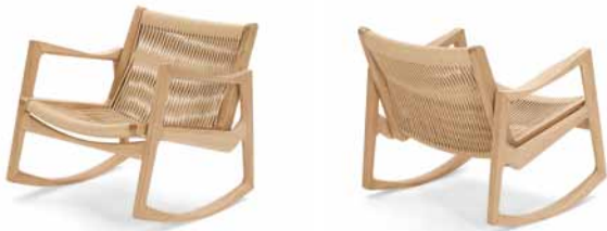
Eiche mit hanffarbener Kordel Oak with hemp-coloured cord

Mecedora | Estructura de roble macizo en acabado natural, barnizado en marrón o negra. A elección, malla de cordel de color negro o cáñamo o con acolchado de poliuretano con cintas de goma y tapicería de piel o tela. Parte inferior de los patines dotada de elementos de fieltro (antideslizantes). Made in Germany.