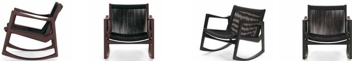
Eiche braun gebeizt mit schwarzer Kordel Oak brown-stained with black cord