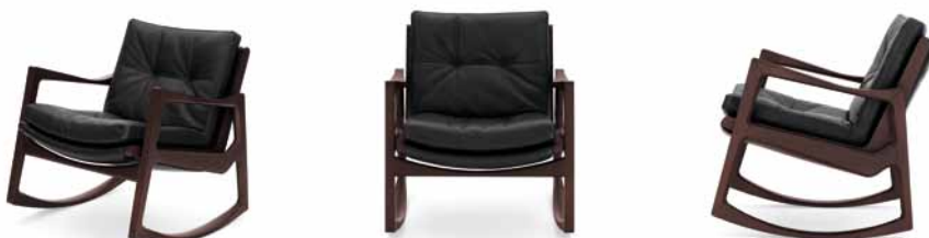
Eiche braun gebeizt mit schwarzem Leder Oak brown-stained with black leather