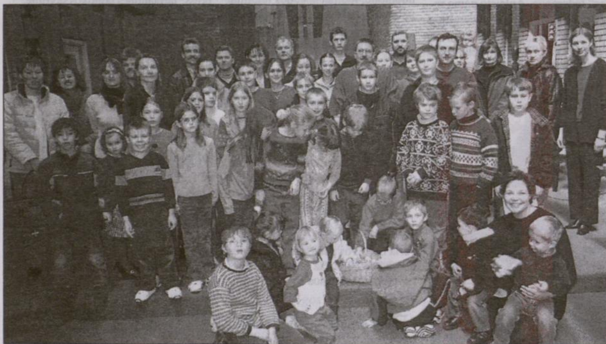
New Yorko Maironio litunistinės mokyklos vaikai, tėveliai ir mokytojai švenčia Šv. Velykas (žr. aprašymą 15 psl.)