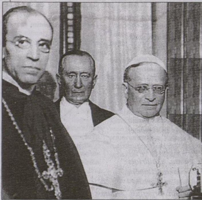
1931 m. vasario 12 d. Radio Vaticana atidaryme (iš k. į deš.): mons. Eugenio Pacelli (būsimasis popiežius Pijus XII), radijo įkūrėjas Guglielmo Marconi ir popiežius Pijus XI