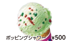
ポッピングシャワー ¥500