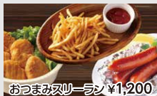
おつまみヌーラーン ¥1,200