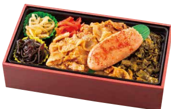
博多一風堂ピリッ辛豚めし & やまや辛子明太子弁当 ¥1,600