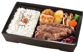
浅草今半 すき焼弁当 ¥2,600