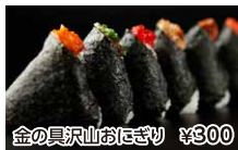
金の具沢山おにぎり ¥800