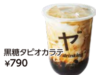
黒糖タピオカラテ ¥790