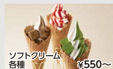
ソフトクリーム 各種 ¥550~