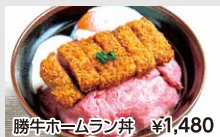
勝牛ホームラン丼 ¥1,480