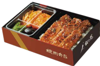
叙々苑 カルビ弁当 ¥3,600