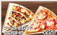
ツーベースセット (ピザ2ピース) ¥950