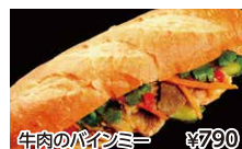
牛肉のバインミー ¥790