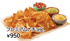
プレミアムナチョス ¥950