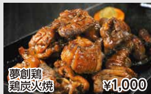
夢創鶏 鶏炭火焼 ¥1,000