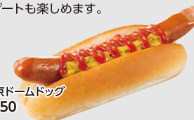
東京ドームドッグ ¥550