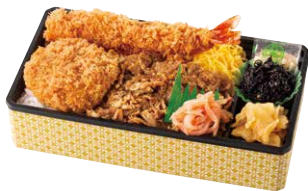
まい泉 黒豚しぐれ塩かつ重 ¥1,600