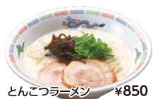
とんこつラーメン ¥850