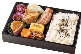
利久 牛たん幕の内弁当 ¥2,300