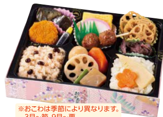
赤飯と季節のおこわ弁当 ¥1,000