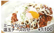
ミートカレー 温玉チーズのせ ¥1,100