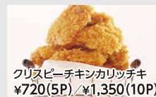
クリスピーチキンカリッチキ ¥720(5P) / ¥1,350(10P)