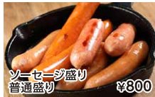
ソーセージ盛り 普通盛り ¥800