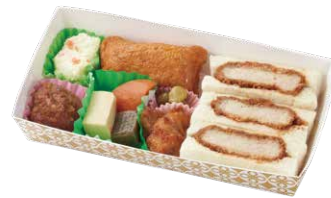
まい泉 メンチかつサンドBOX ¥1,100