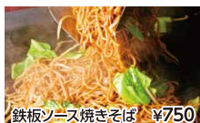
鉄板ソース焼きそば ¥750