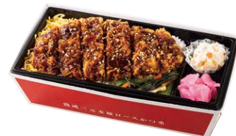
さぼてん ロースかつ重 ¥1,200