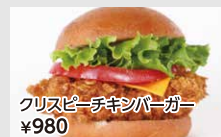
クリスピーチキンバーガー ¥980