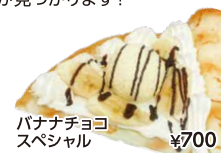
バナナチョコ スペシャル ¥700