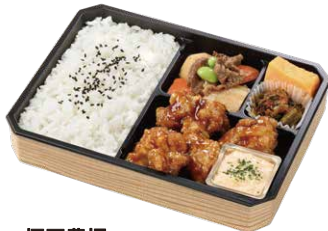
塚田農場 若鶏のチキン南蛮弁当 ¥1,100