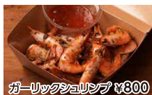
ガーリックシュリンプ ¥800