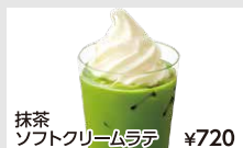
抹茶ソフトクリームラテ ¥720