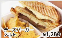
チーズバーガー メルト ¥1,280