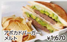
アボカドバーガー メルト ¥1,670