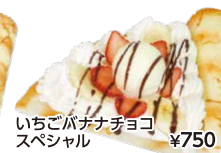
いちごバナナチョコ スペシャル ¥750