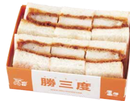
ホームラン万かつサンド ¥960