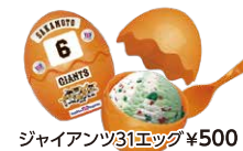
ジャイアント31エッグ ¥500