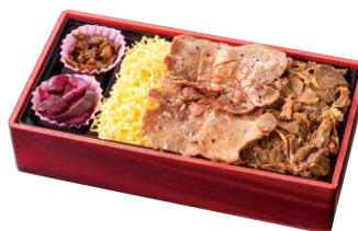
利久 牛たん3色弁当 ¥1,100