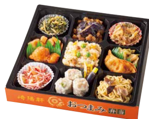
崎陽軒 おつまみ弁当 ¥1,600