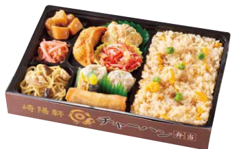
崎陽軒 チャーハン弁当 ¥1,200