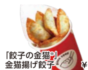
「餃子の金猫」 金猫揚げ餃子 ¥650