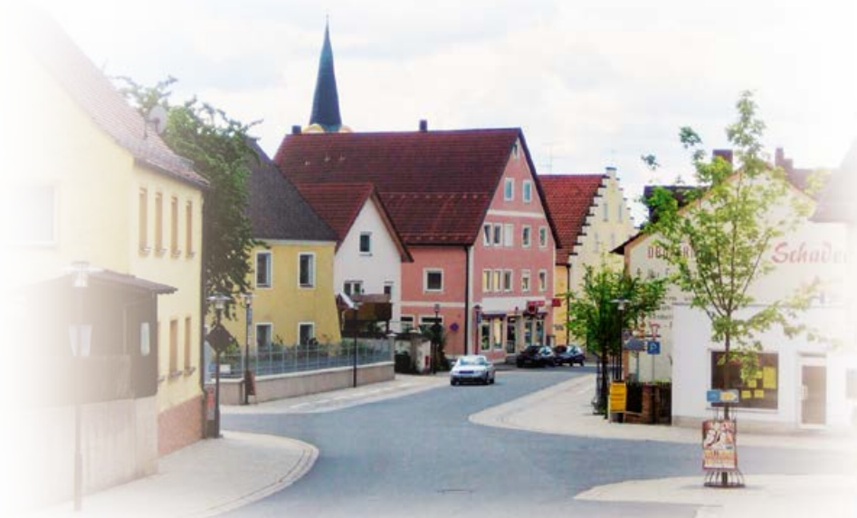
Bild: Markt Schwarzenfeld Nabburger Straße und Hauptstraße, Ortskernsanierung

Durch den Zuzug zahlreicher Vertriebener nach Kriegsende 1945 stieg nicht nur die Einwohnerzahl in Schwarzenfeld erheblich. Der Ort erfuhr zusätzlich einen beträchtlichen wirtschaftlichen und kulturellen Aufschwung. So wurde beispielsweise 1948/49 das erste Jugendheim erbaut. Außerdem entstand 1949/51 ein neues Schulhaus, welches in den Jahren 1959/61 und 1978/81 erweitert wurde. 1964 wurde schließlich die erste Kläranlage errichtet. Schwarzenfeld wuchs in dieser Zeit weiter an. Im Zuge der Gebietsreform wurden 1972 die bisher selbstständigen Gemeinden Pretzabruck und Frotzersricht (mit Ausnahme des Gemeindeteils Wohlfest) eingegliedert.