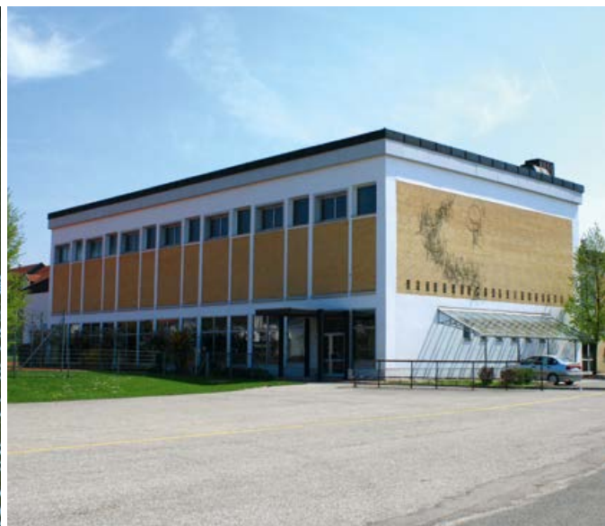
Turn- und Schwimmhalle