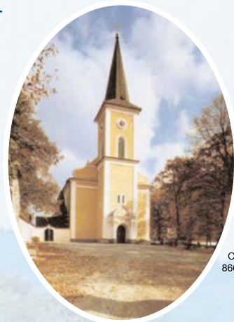
Oefele Verlag, 86678 Ehingen