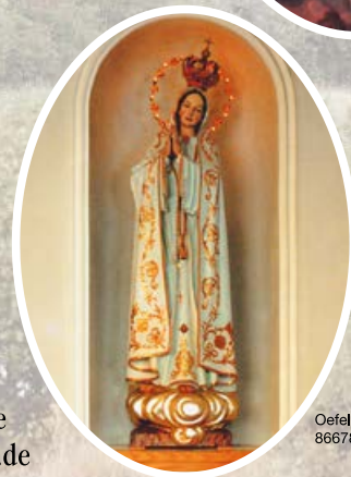
Oefele Verlag, 86678 Ehingen

Miesbergallee 16, 92521 Schwarzenfeld Telefon 0 94 35 / 23 52 · E-Mail: schwarzenfeld@passionisten.de Internet: www.passionisten.de