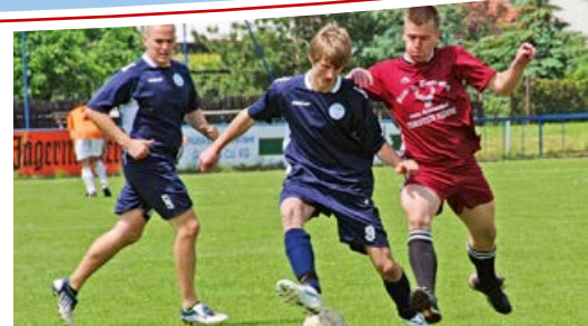
Sportverein Strehla e. V.

In den Vereinen der Stadt Strehla spiegelt sich ein reges kulturelles und sportliches Leben wider und bietet eine Vielzahl von Freizeitmöglichkeiten für die ganze Familie. Das Leben der Vereine wird natürlich von den Mitgliedern selbst geprägt, aber auch von vielen freiwilligen ehrenamtlichen Helfern, Trainern und solchen die wichtige Vereinsstrukturen ausfüllen. Neue Mitglieder sind jederzeit willkommen. Sie können sich bei nachfolgender Auflistung selbst ein Bild von der Vielfalt des Vereinslebens in der Stadt Strehla machen. Hier die Kontaktdaten: