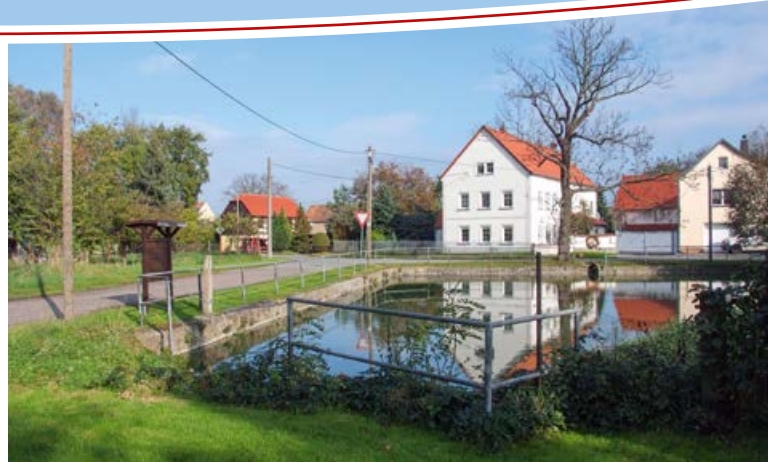
Großrügeln, Dorf- und Feuerwehrteich