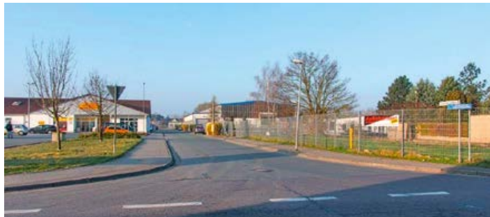
Gewerbegebiet An der alten Leimfabrik

Große Industrieansiedlungen finden Sie leider nicht in unserer Stadt. Strehla ist überwiegend geprägt vom Kleinhandwerk und Gewerbe.