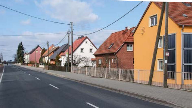
Ortsteil Oppitzsch, Gröbaer Straße