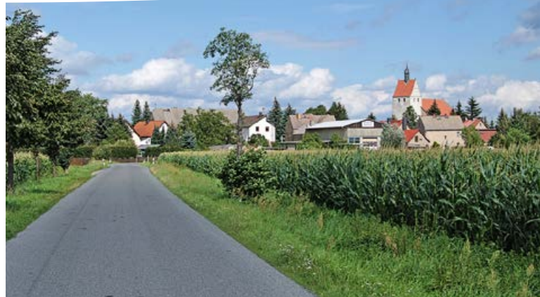
Ortseinfahrt OT Paußnitz

eingemeindet: 01.09.1973 Fläche: 203 ha Einwohner: 144 (Stand 30.06.2014)