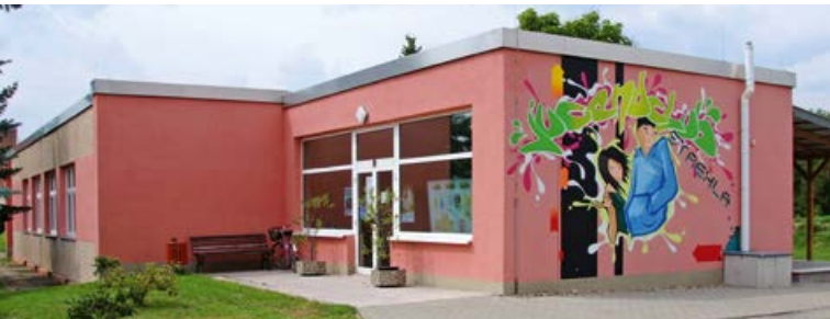
Foto mitte: Jugend- und Freizeitzentrum mit Bibliothek; Foto: unten: Wohnanlage für Senioren