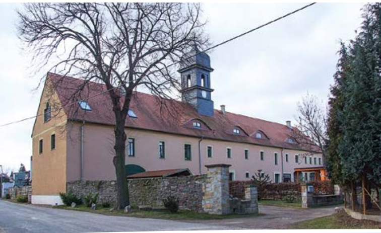
Ehemaliges Rittergut Görzig

eingemeindet: 01.07.1950 Fläche: 599 ha Einwohner: 189 (Stand 30.06.2014)