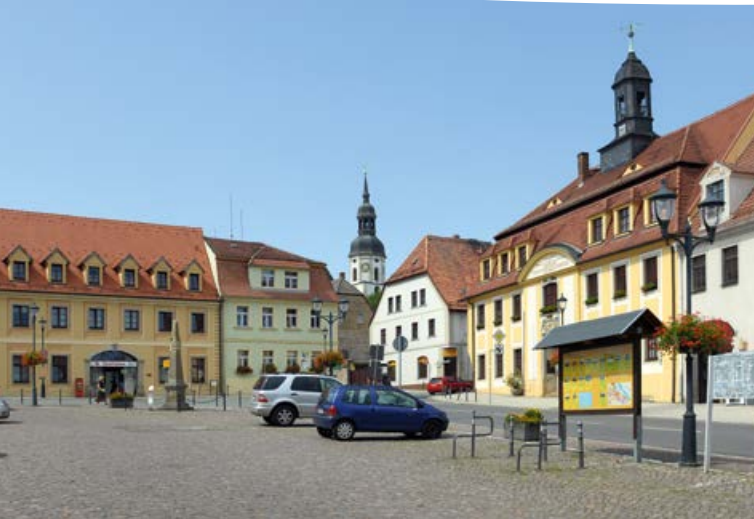
Marktplatz Strehla mit Postmeilensäule