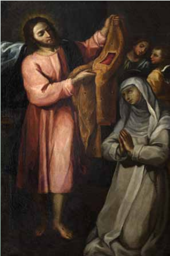
Pittore senese del XVII secolo Santa Caterina riceve una veste da Cristo olio su tela (Rettorato dell'Università di Siena)

Delibera del Consiglio di amministrazione 20 aprile 2018