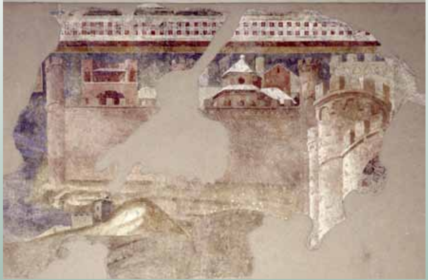
Ambrogio Lorenzetti (Siena, documentato dal 1319 al 1348), Particolare della città di Thane frammento di affresco proveniente dal convento di San Francesco (Rettorato dell'Università di Siena)