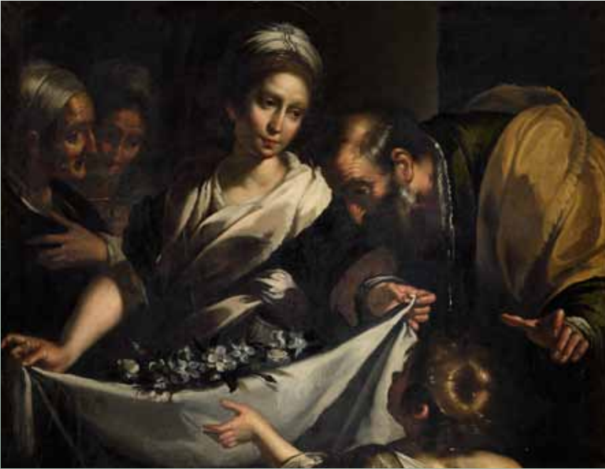
Bottega di Bernardo Strozzi (Genova 1581-Venezia 1644), Miracolo di Santa Zita olio su tela (Rettorato dell'Università di Siena)