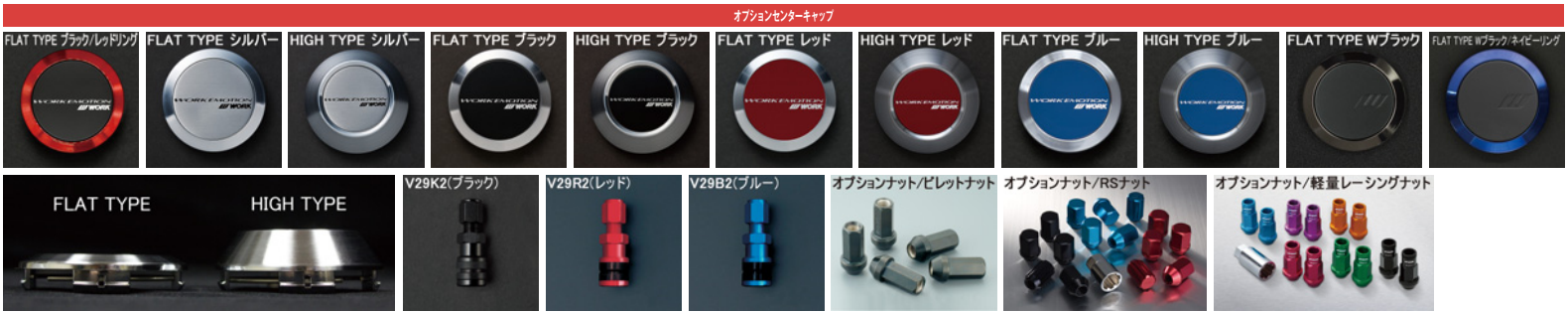
※ナットの詳細について▶P.268