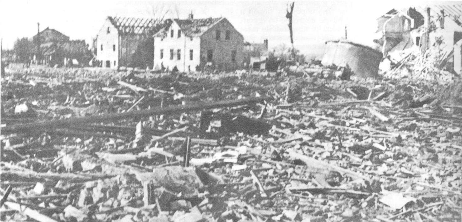
Приликом напуштања Добоја половином априла 1945, Немци су порушили све фабрике и велики број јавних и приватних зграда

У многим бојевима и операцијама, вођеним од 21. октобра 1944. до 14. априла 1945, током напорних