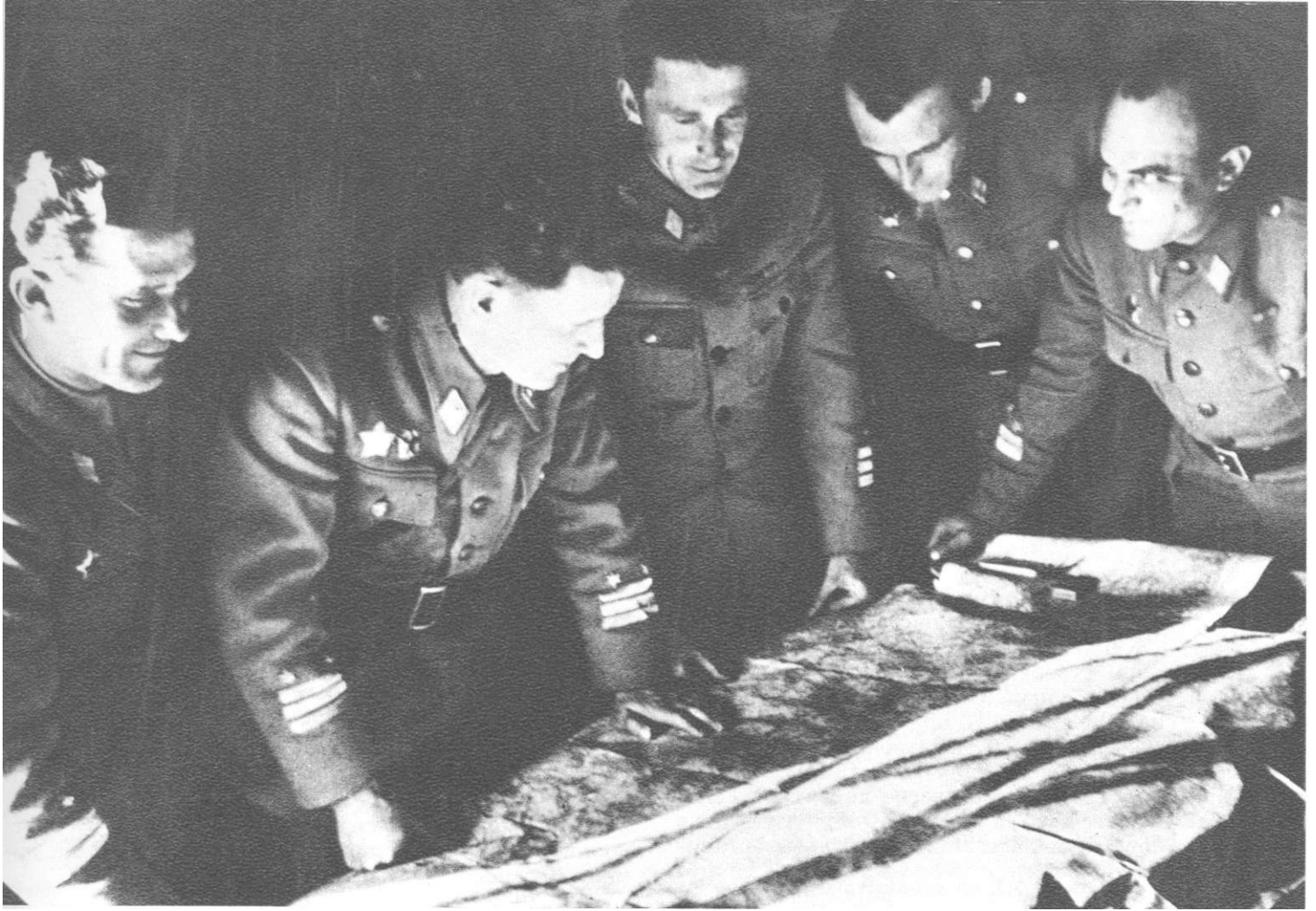
Команданти 1. и 3. армије генерали Пеко Дапчевић (други слева) и Коста Нађ (трећи слева) разматрају ситуацију насталу после пробоја сремског фронта половином априла 1945; први здесна је начелник Штаба 3. армије пуковник Вукашин Суботић

дигле су Славонски Брод, а јединице 2. армије Босански Брод.