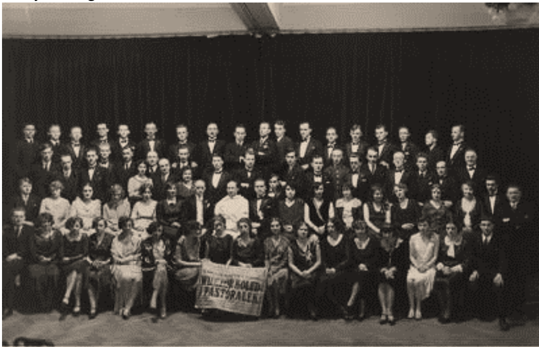
Chór Towarzystwa Oratoryjnego. Kraków, 1930 r.